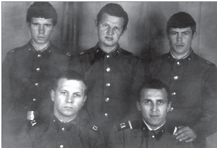
Мои армейские друзья, 1975