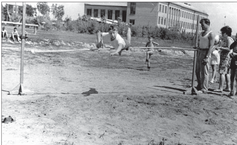
С. Киреев, спартакиада в пионерлагере «Ленинец», 1965