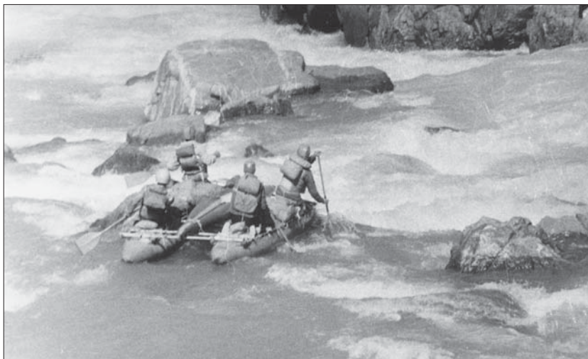
Река Обихингоу (Таджикистан), 1982, спортсмены московского «Буревестника»