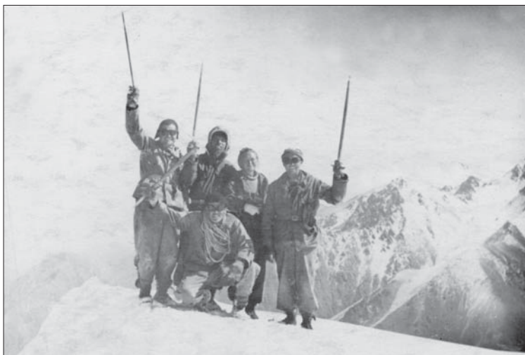
Тянь-Шань, 1958, крайний справа (стоит) — мой отец