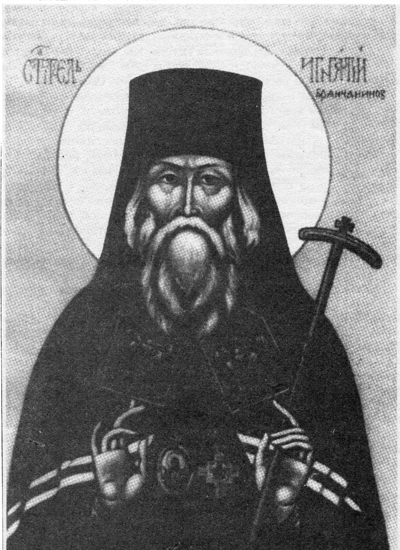
Святитель Игнатий (Брянчанинов)