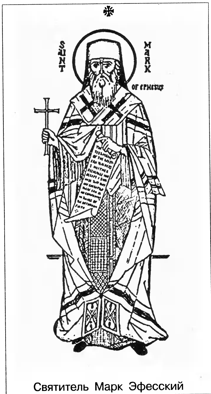
Святитель Марк Эфесский