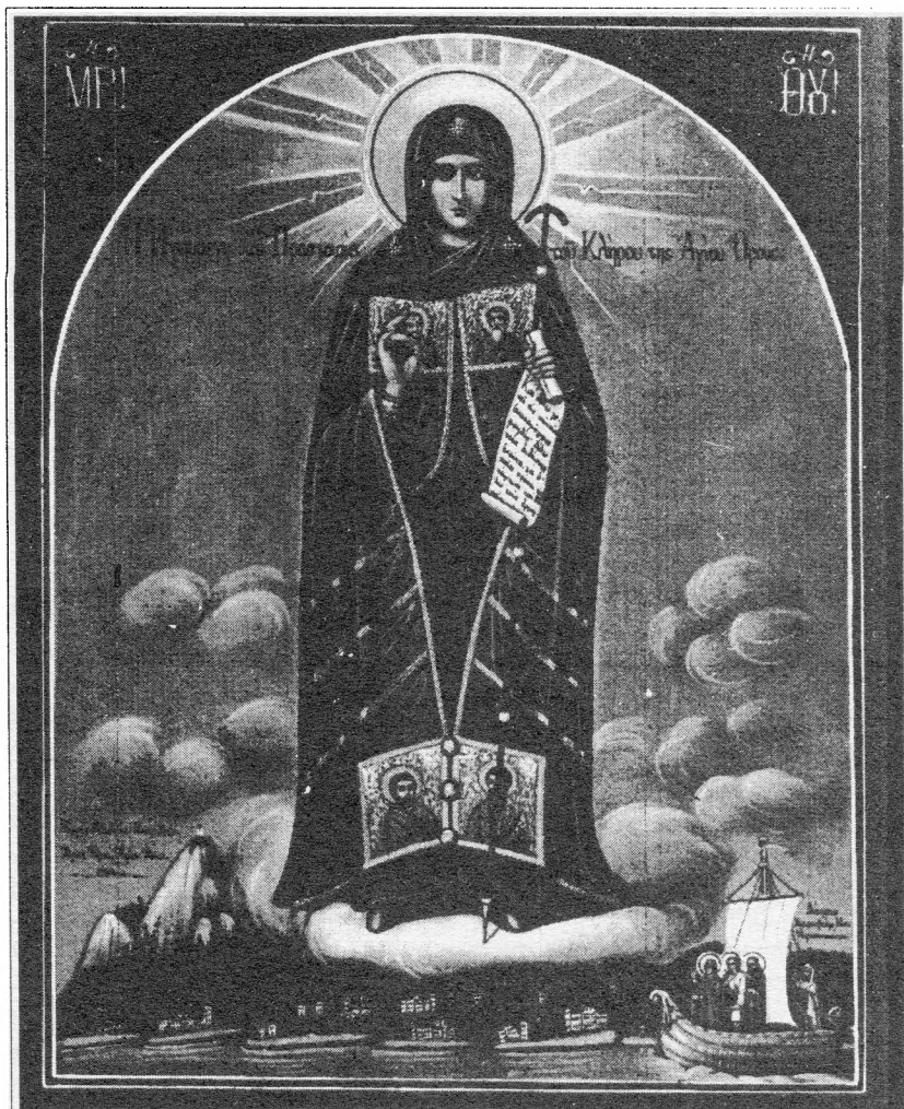
Икона Божией Матери “Игумения Горы Афонской”