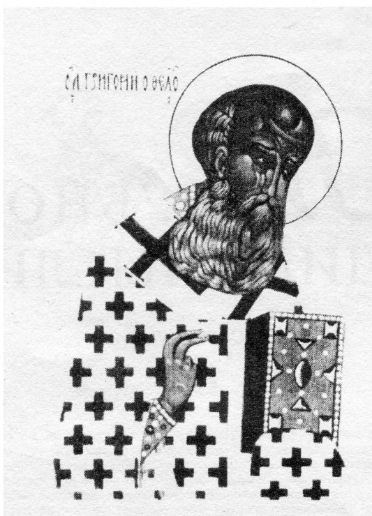
Святитель Григорий Богослов

“Да не подумают, будто бы я утверждаю, что всяким словом надобно дорожить. Ибо знаю, что есть прекрасное разногласие и самое пагубное единомыслие; но должно любить добрый мир, имеющий добрую цель и соединяющий с Богом. Когда идет дело о явном нечестии, тогда должно скорее идти на огонь и меч, не смотреть на требования времени и властителей и вообще на все, нежели приобщаться лукавого кваса и прилагаться к зараженным. Всего страшней – бояться чего-либо более, нежели Бога, и по сей боязни служителю истины стать предателем учения веры и истины”.