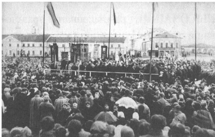
Молебен по случаю 300-летия г. Архангельска. Сентябрь 1884 г.