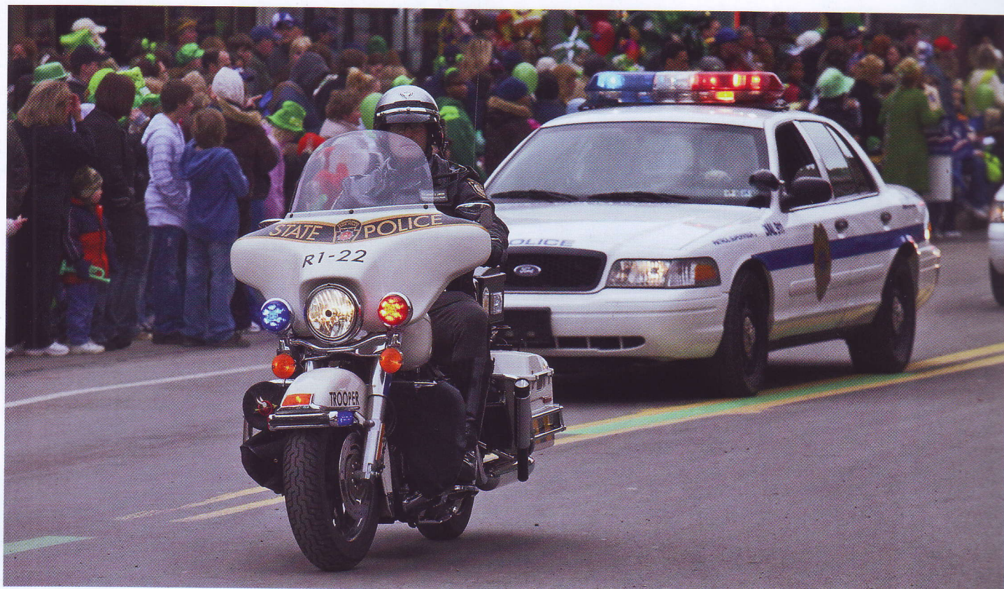
ПОЛИЦИЯ ШТАТА ПЕНСИЛЬВАНИЯ ОБЕСПЕЧИВАЕТ БЕЗОПАСНОСТЬ НА ПРАЗДНИКЕ СВЯТОГО ПАТРИКА

Пенсильвания — штат на северо-востоке США с населением более 12,6 миллионов человек. Он был образован 12 декабря 1782 года.