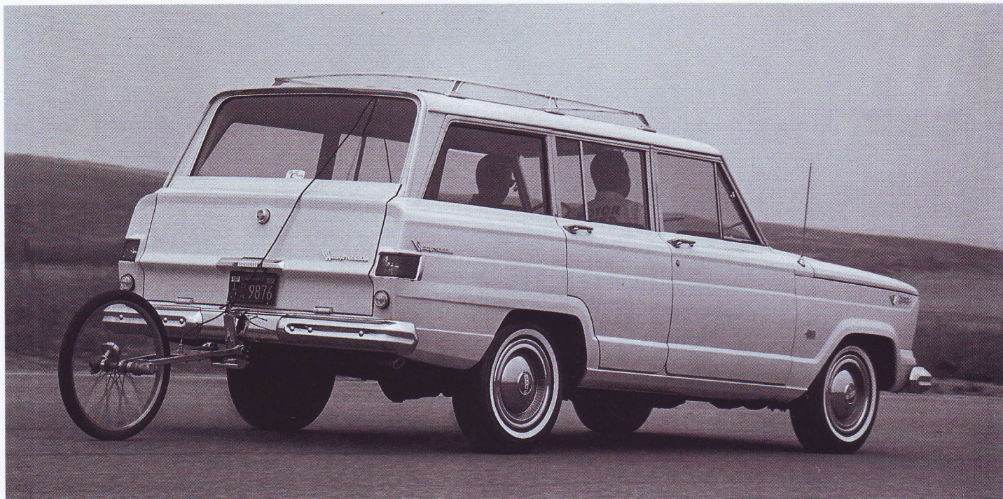
JEEP WAGONEER V-8 ВО ВРЕМЯ ДОРОЖНЫХ ИСПЫТАНИЙ (23 ИЮНЯ 1965 ГОДА)

альянса на свет появилась новая фирма — Kaiser-Jeep. Поначалу ее руководство хотело свернуть производство Wagoneer, однако вскоре стало ясно, что машина имеет хорошие перспективы, и было решено не снимать ее с конвейера. Первая серия Wagoneer выпускалась без существенных изменений до февраля 1970 года, когда марка Jeep снова сменила хозяина. Новым владельцем бренда стала корпорация American Motors, выделившая производство внедорожников в отдельное подразделение. Название для него напрашивалось само собой — Jeep. Wagoneer продолжали выпускать, но с 1973 года название модели стало иным — Wagoneer SJ Series 2. Эта серия стояла на конвейере до 1987 года, именно к ней и относятся машины, выпущенные в 1980 году.