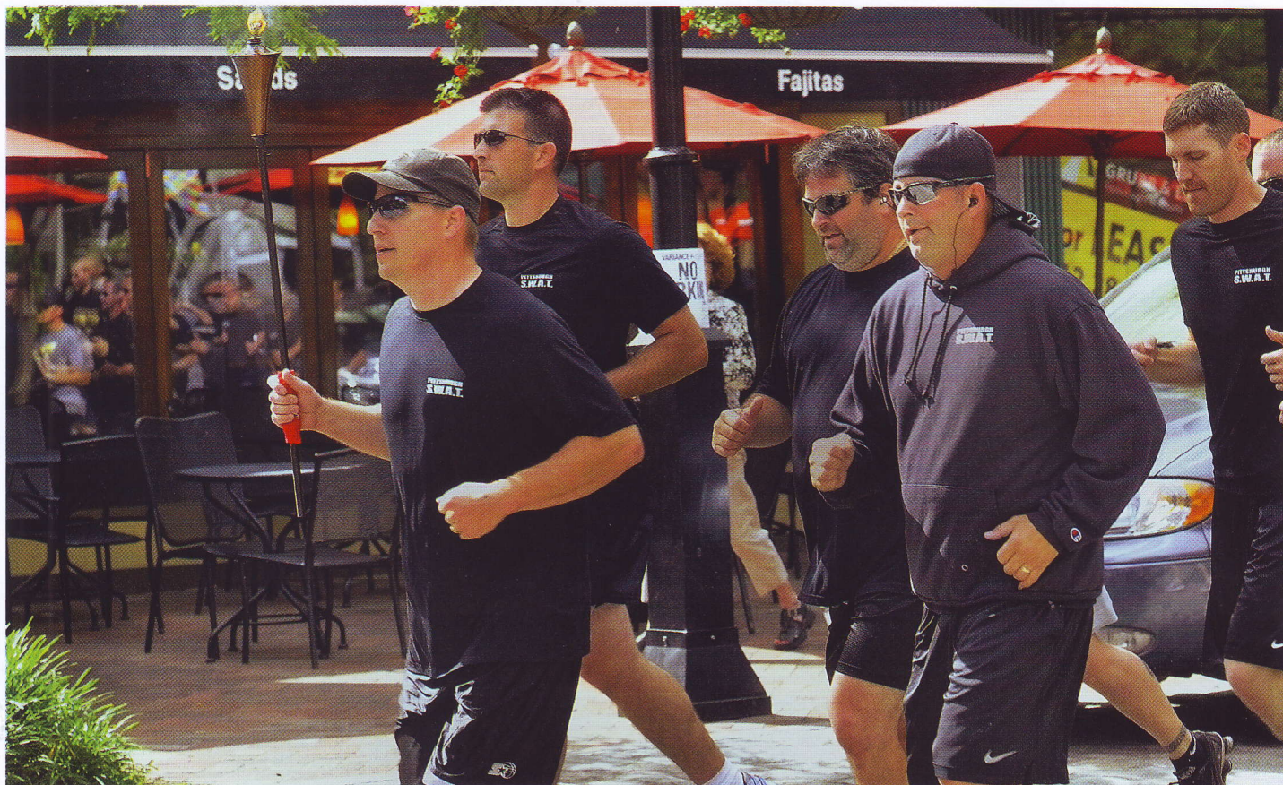
ОФИЦЕРЫ ПОЛИЦИИ ПИТСБУРГА УЧАСТВУЮТ В ЦЕРЕМОНИИ ОТКРЫТИЯ ПОЛИЦЕЙСКОЙ ОЛИМПИАДЫ (5 ИЮНЯ 2012 ГОДА)

К тому времени правительство штата пришло к выводу, что две с небольшим сотни человек не в состоянии обеспечивать конституционный порядок на столь обширной территории, и на следующий год в полицию было принято еще около 6 тысяч человек. Службу несли как пешие, так и конные полицейские. А вот первое мотоциклетное подразделение появилось на дорогах штата только в 1919 году. Начинание оказалось успешным, и к апрелю следующего года в состав подразделения входило уже более 70 полицейских-мотоциклистов.