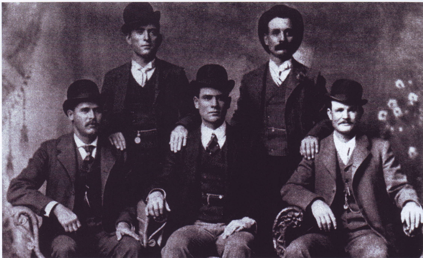
БУЧ КЭССИДИ (КРАЙНИЙ СПРАВА В ПЕРВОМ РЯДУ) И ДРУГИЕ ЧЛЕНЫ «ДИКОЙ БАНДЫ»

Рассказывают, что впервые нарушить закон Роберту пришлось в юности, когда он работал в городе Хей Спрингс в штате Небраска. Молодой человек пришел в лавку, где торговали одеждой, но она оказалась закрытой. Недолго думая, он сломал замок, взял брюки, кусок пирога и ушел, оставив записку, что заплатит при первой же возможности.