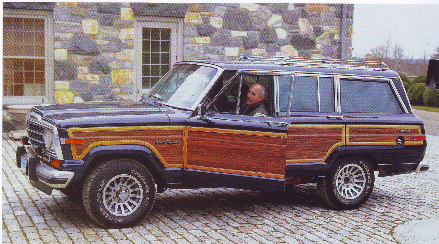
МНОГИЕ ВЛАДЕЛЬЦЫ JEEP WAGONEER ПРЕДПОЧИТАЮТ ВЫЕЗЖАТЬ ТОЛЬКО НА ПАРАДЫ СТАРИННОЙ ТЕХНИКИ

на все колеса. Как следует из названия, эта модификация комплектовалась V-образным 8-цилиндровым двигателем объемом 5896 см 3 и мощностью 157 л. с. и 3-ступенчатой коробкой-автоматом. Помимо этого, в продажу поступала ограниченная версия Wagoneer Limited.