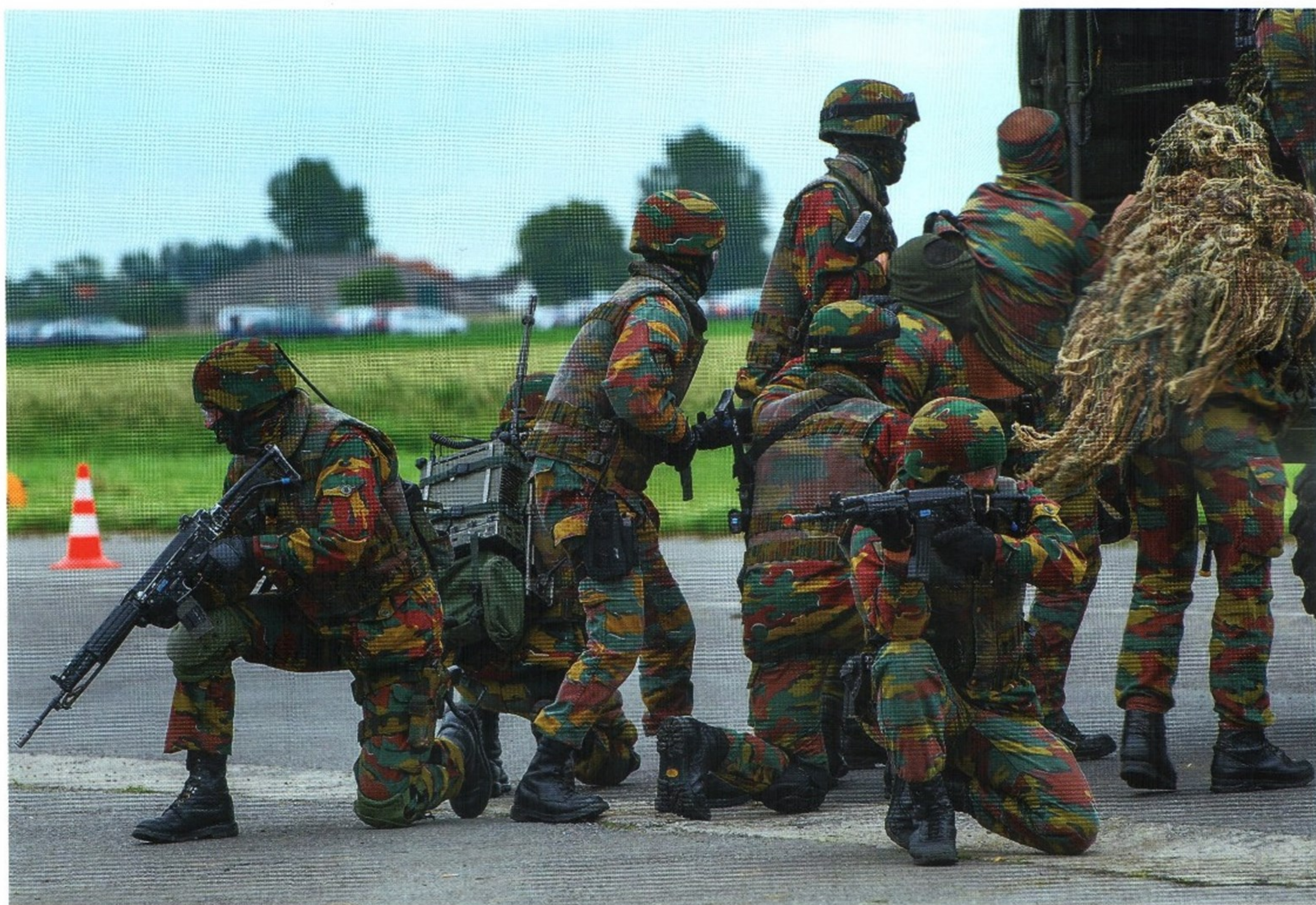
СОТРУДНИКИ СПЕЦПОДРАЗДЕЛЕНИЯ ПОКИДАЮТ ПОЛИГОН, ГДЕ ОТРАБАТЫВАЛИСЬ НАВЫКИ ПРОВЕДЕНИЯ ОПЕРАЦИЙ В ПОЛЕВЫХ УСЛОВИЯХ

учатся действовать не только на суше, но и на море. Помимо этого, они занимаются тактической подготовкой, отрабатывают приемы управления автомобилями и мотоциклами на высоких скоростях во время погони за правонарушителями. Что отличает SIE от зарубежных аналогов? Среди его бойцов не только мужчины, но и женщины. Правда, для дам доступны лишь служба в группах наблюдения и работа под прикрытием. Прослужив пять лет, сотрудники имеют право закончить курсы по одной из наиболее востребованных специальностей — дайвер, кинолог или снайпер.