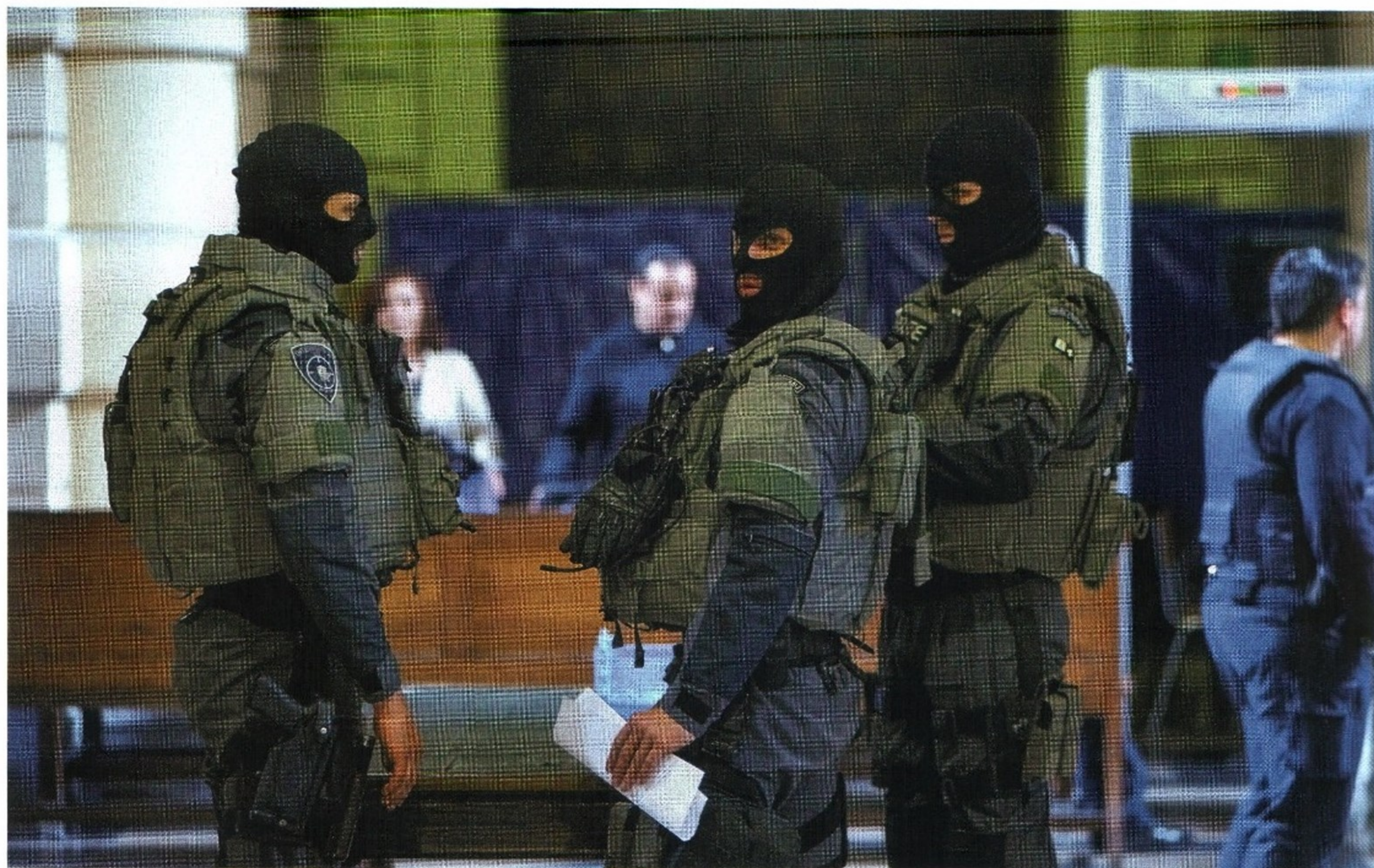
БОЙЦЫ БЕЛЬГИЙСКОГО ПОЛИЦЕЙСКОГО СПЕЦНАЗА У ЗДАНИЯ СУДА В БРЮССЕЛЕ, ГДЕ ПРОХОДИЛ ПРОЦЕСС НАД ИСЛАМСКИМИ ТЕРРОРИСТАМИ (МАЙ 2010 ГОДА)

Королевство Бельгия — страна в центре Европы площадью 30 513 квадратных километров с населением свыше 10,4 млн человек. Государственные языки — нидерландский и французский. Столица — Брюссель, где находятся не только административные органы самого королевства, но и многие институты Евросоюза.