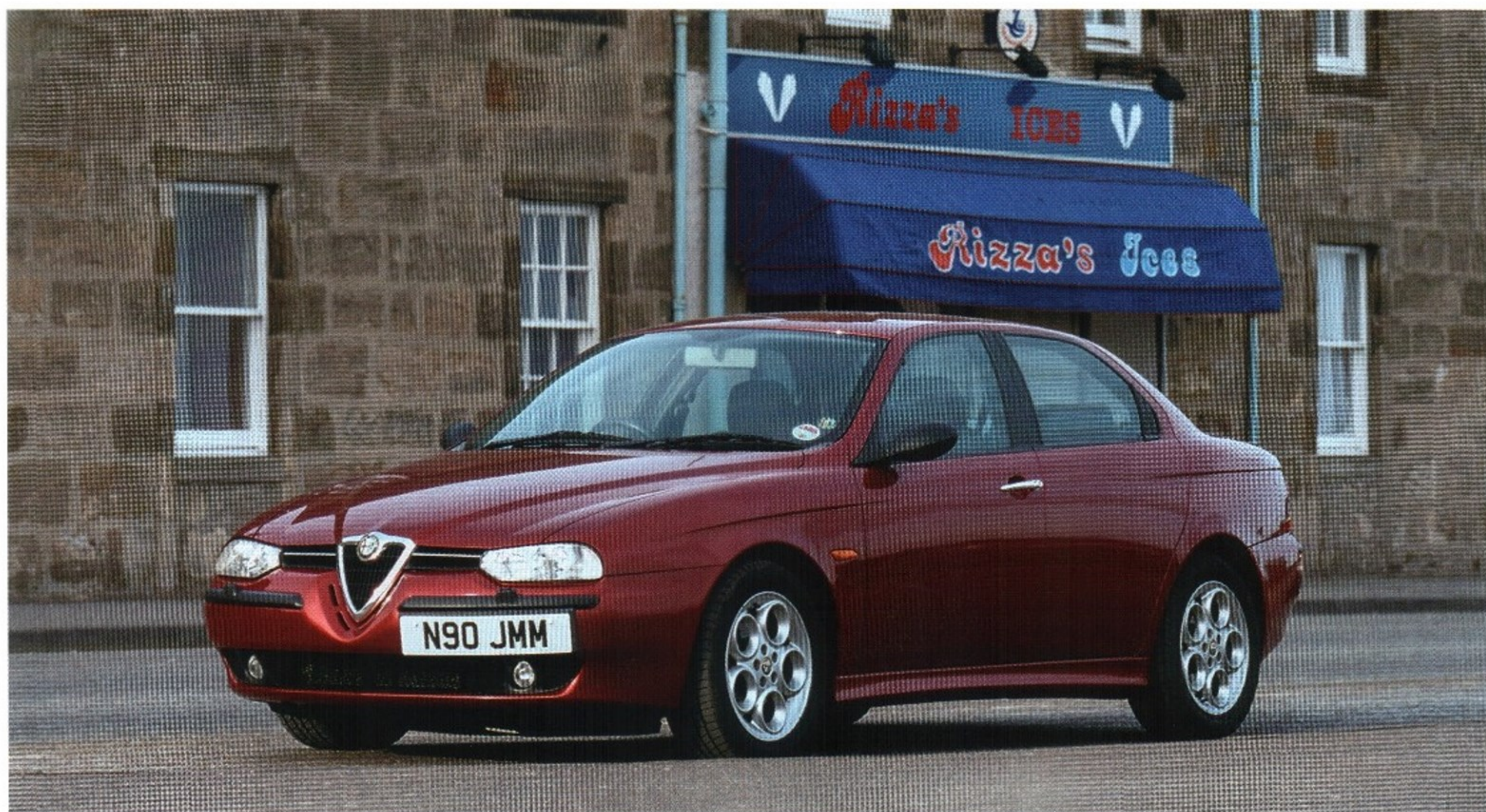
ALFA ROMEO 156 ПЕРВОГО ПОКОЛЕНИЯ, ДЕБЮТИРОВАВШАЯ В 1997 ГОДУ

оборудовались «зимним пакетом», включавшим «усиленный» аккумулятор, противотуманные фары и некоторые другие аксессуары.