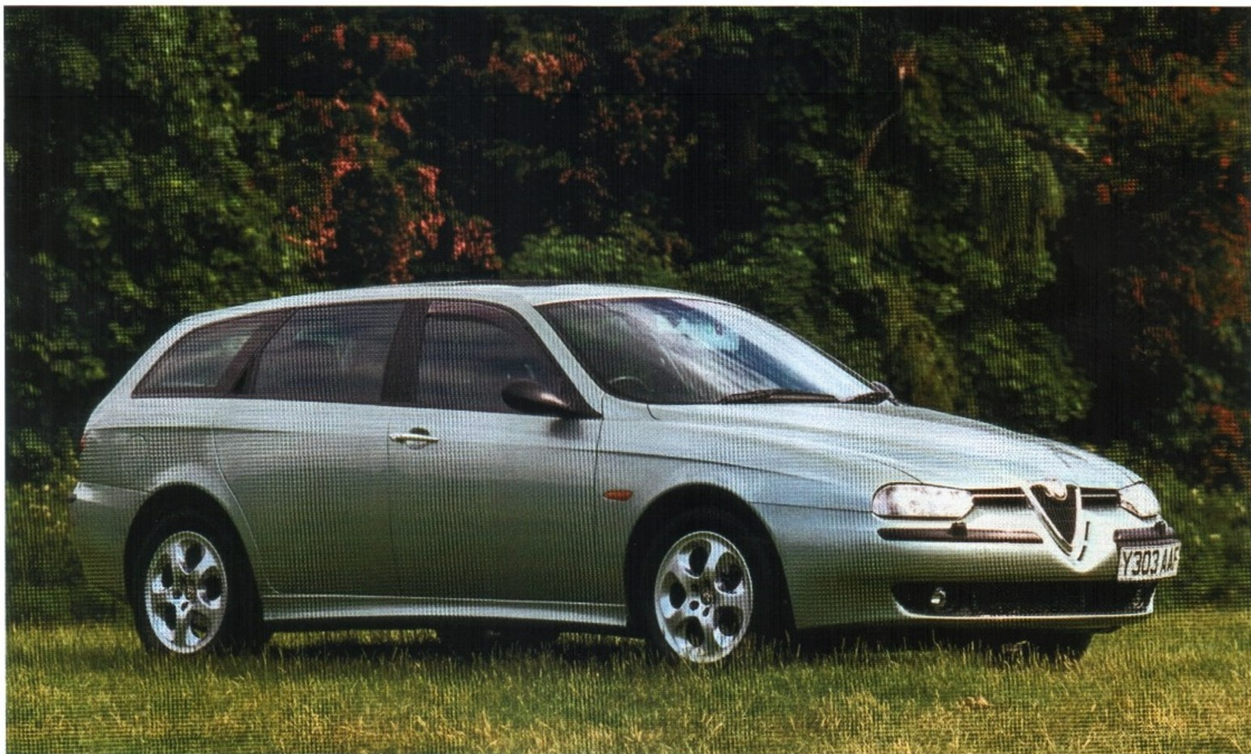
ALFA ROMEO 156 С КУЗОВОМ «УНИВЕРСАЛ» 2001 МОДЕЛЬНОГО ГОДА

Новинку отличала эффектная спортивная внешность. Линейка моторов состояла из трех 4-цилиндровых рядных двигателей объемом 1,6; 1,8 и 2,0 л, в дополнение к которым предлагалась V-образная 2,5-литровая «шестерка».