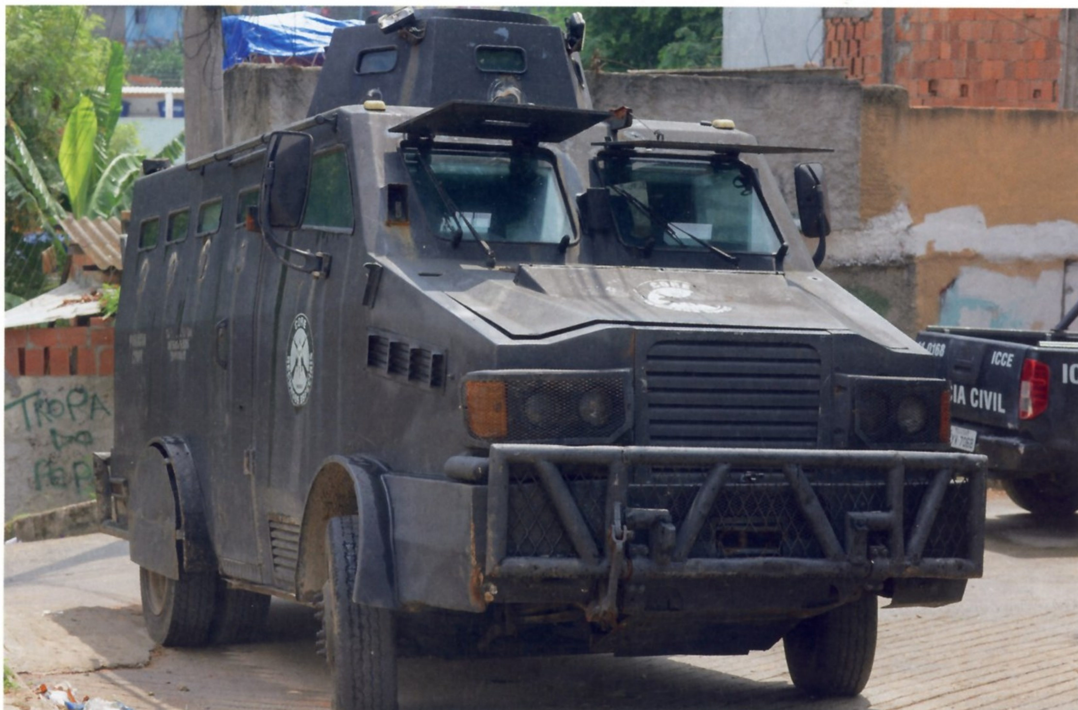
БРОНИРОВАННЫЙ ПОЛИЦЕЙСКИЙ АВТОМОБИЛЬ, ПРИНАДЛЕЖАЩИЙ ВОРЕ, В ФАВЕЛАХ РИО-ДЕ-ЖАНЕЙРО

Бразилия — самое крупное государство Южной Америки. Здесь проживает около 203 миллионов человек, из которых примерно 50 миллионов находятся за чертой бедности. Как следствие — высокий уровень преступности, который за последние 20 лет вырос в полтора раза. По этому показателю страна занимает четвертое место в мире. Самыми криминогенными регионами Бразилии считаются Рио-де-Жанейро и Сан-Паулу. В списке неблагополучных городов числится и столица — город Бразилия. В стране процветает уличная и бытовая преступность, активно действуют крупные организованные преступные группировки. Противостоять преступникам призваны полицейские силы, создававшиеся некогда по американскому образцу. Наиболее известные — военная (polícia militar), гражданская (polícia