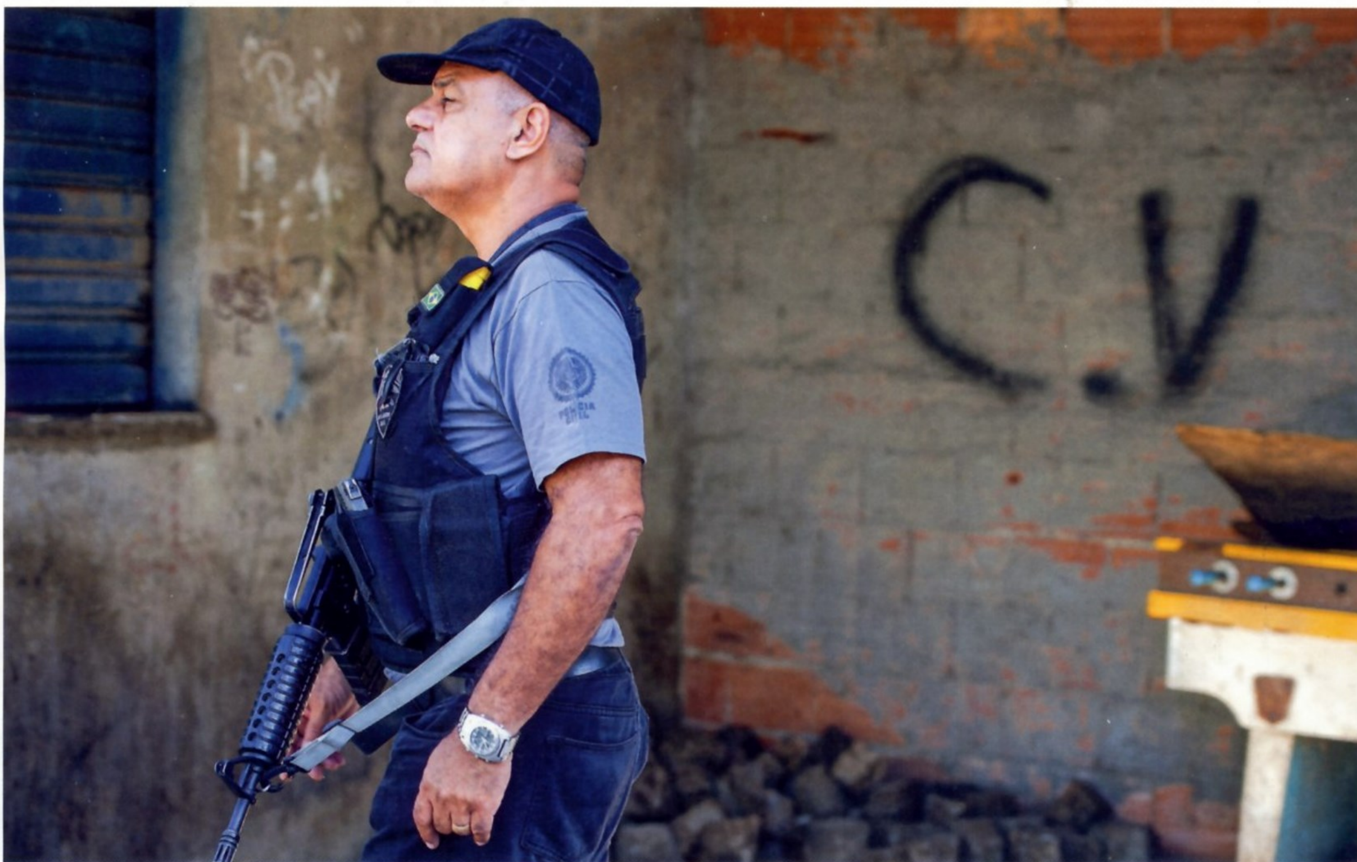
КАЖДЫЙ ЖИТЕЛЬ РИО ПОНИМАЕТ, О ЧЕМ ГОВОРЯТ БУКВЫ CV НА СТЕНАХ ДОМОВ — ЭТО ЗНАЧИТ, ЧТО РАЙОН НАХОДИТСЯ В СФЕРЕ ВЛИЯНИЯ «КРАСНОЙ КОМАНДЫ»

Сегодня активность «Красной команды» несколько снизилась, но она по-прежнему фактически управляет многими районами города — они «помечены» настенными граффити в виде букв CV. Согласно полицейским данным, в 2005 году «Красная команда» контролировала 53 % самых опасных районов. Благодаря жестким действиям полиции и армии, к 2008 году ее влияние снизилось до 39 %, но до сих пор остается весьма значительным.