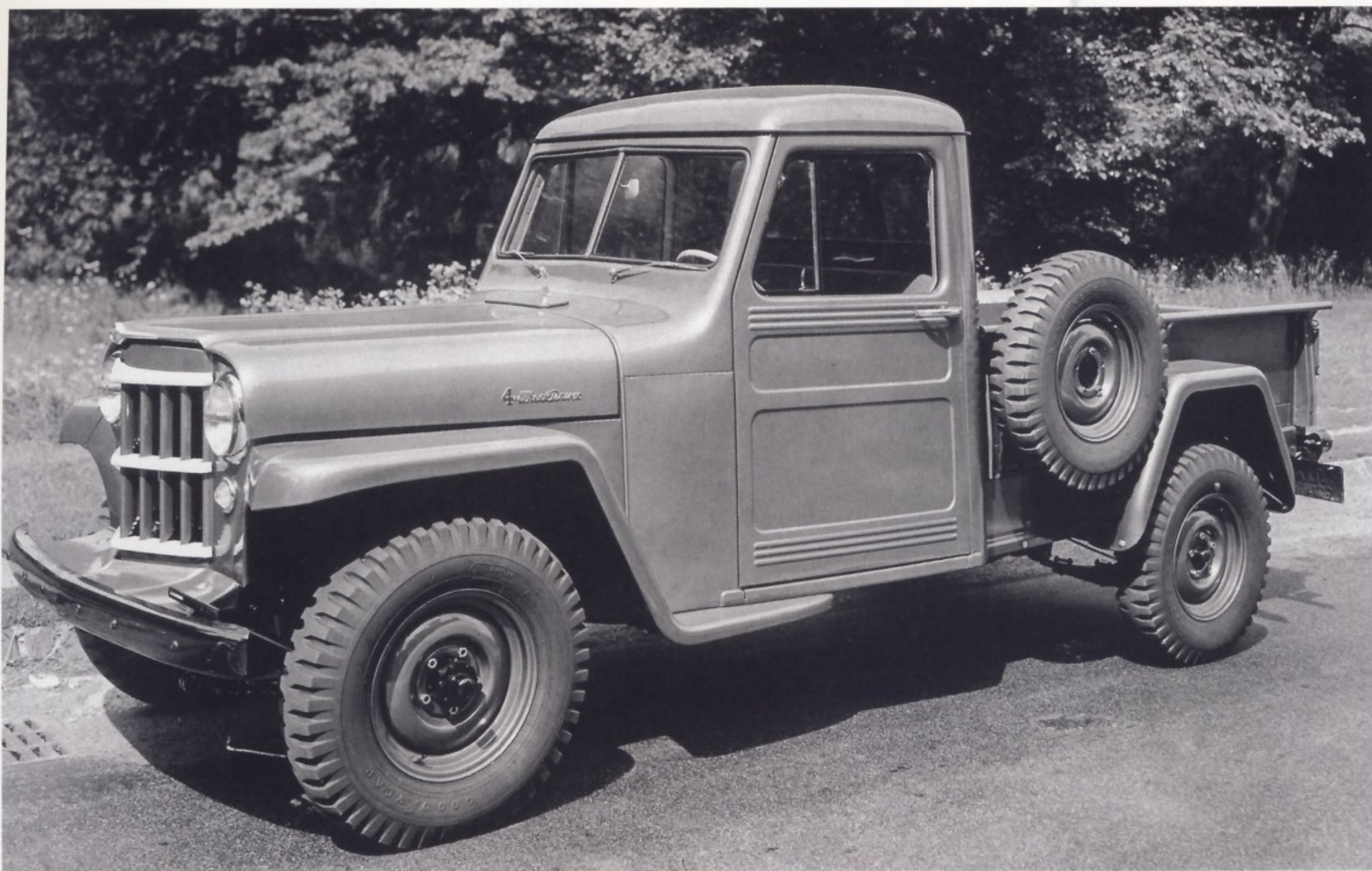
В НАЧАЛЕ 50-Х ГОДОВ ПРОШЛОГО ВЕКА В США НА БАЗЕ JEER ВЫПУСКАЛСЯ ПОЛНОПРИВОДНОЙ ГРУЗОВОЙ ПИКАП ГРУЗОПОДЪЕМНОСТЬЮ В ОДНУ ТОННУ

Jeep Universal. Оба типа машин были востребованы: первый — в городах, второй — среди сельского населения.