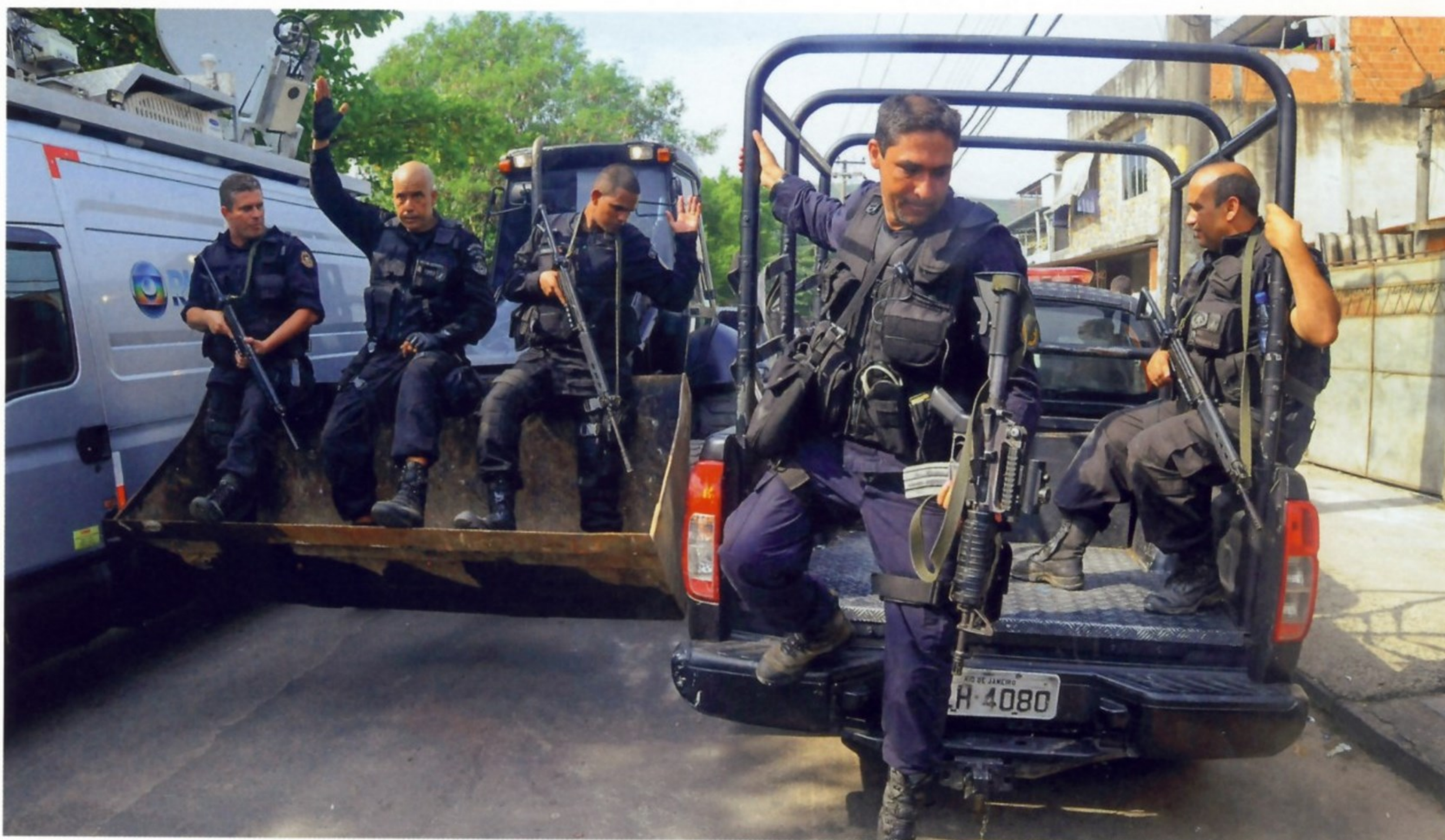
В МАЕ 2014 ГОДА В ТРУЩОБАХ РИО-ДЕ-ЖАНЕЙРО РАЗРАЗИЛАСЬ НАСТОЯЩАЯ ВОЙНА ПОЛИЦИИ С НАРКОТОРГОВЦАМИ, ПОТРЕБОВАВШАЯ УЧАСТИЯ СПЕЦОТРЯДА ВОРЕ И АРМЕЙСКИХ ПОДРАЗДЕЛЕНИЙ

поддержки при спецоперациях, подавление тюремных бунтов, розыск и арест наркоторговцев и главарей местных банд. Одно из таких подразделений было создано в Рио-де-Жанейро и называлось Batalhão de Operações Policiais Especiais (BOPE) — батальон специальных полицейских операций.