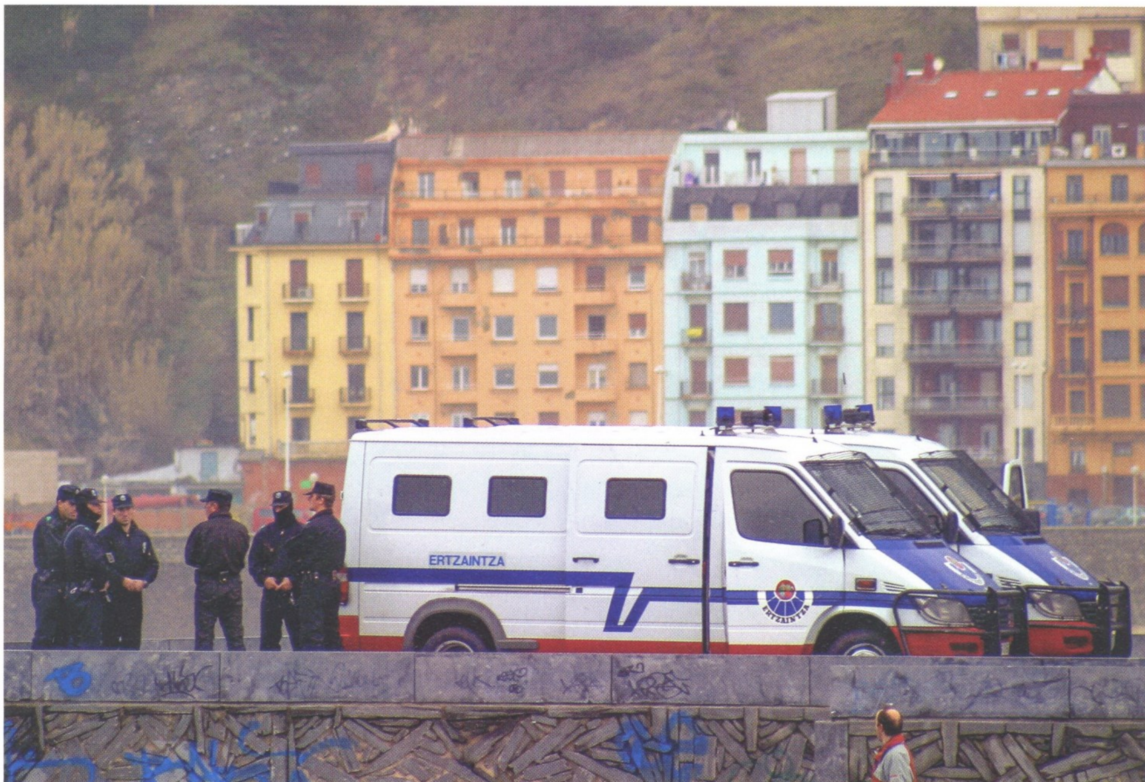
В АРСЕНАЛЕ БАСКСКОЙ ПОЛИЦИИ СОВРЕМЕННЫЕ ПОЛИЦЕЙСКИЕ АВТОМОБИЛИ, ПРИСПОСОБЛЕННЫЕ ДЛЯ РЕШЕНИЯ САМЫХ РАЗНЫХ ЗАДАЧ

Баски — один из древнейших народов, населяющих современную Европу. В Испании они живут в автономной области на северо-востоке, называемой Страна Басков (Euskadi), или Баскония. Столица области — Витория-Гастейс. Площадь автономии — 7235 км 2 . На этой территории располагаются три провинции — Алава, Бискайя и Гипускоа с населением около 2 млн 200 тыс. человек. Государственных языков здесь два — баскский и испанский.