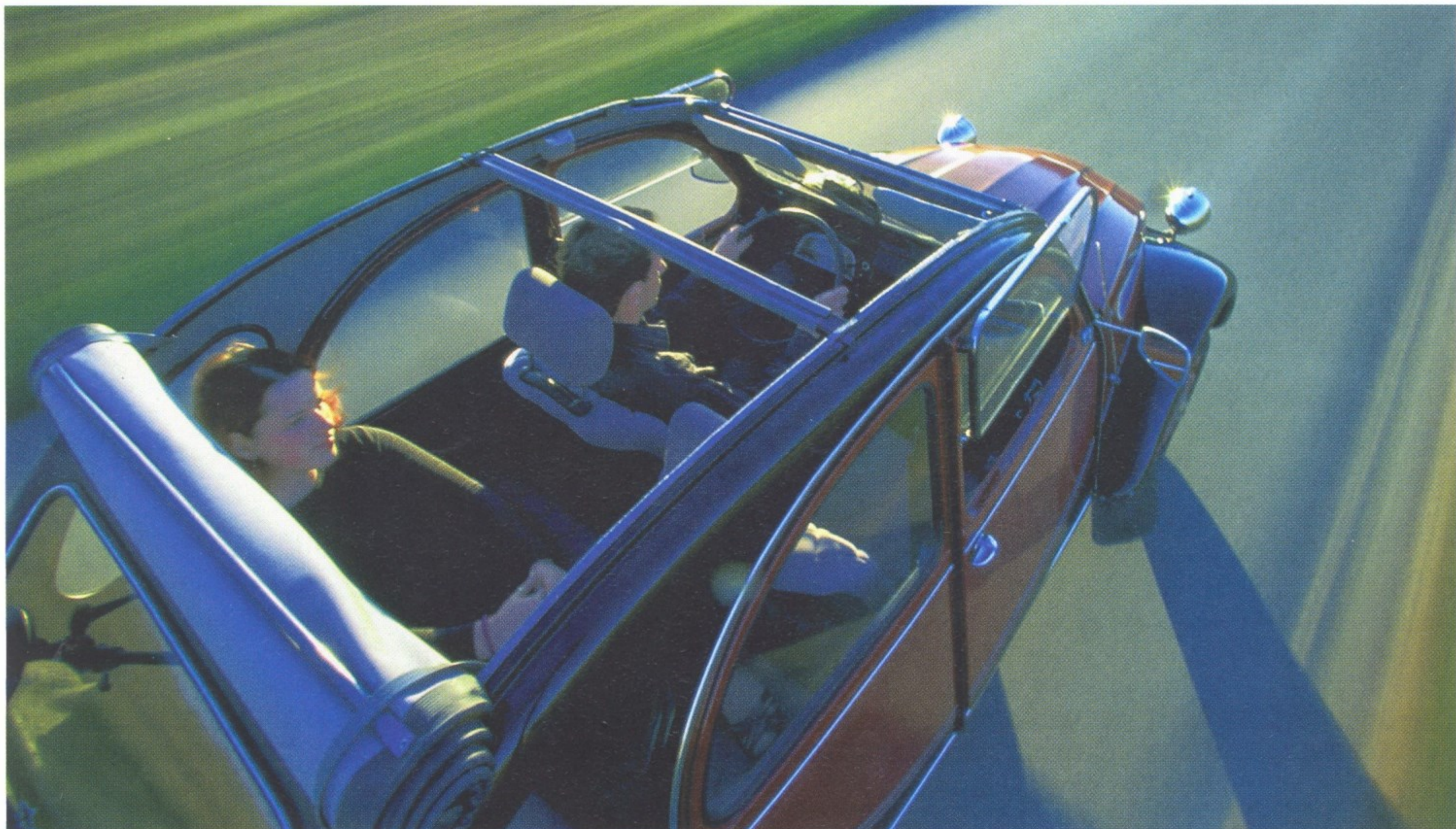
НА НЕКОТОРЫХ МОДЕЛЯХ СЕРЕДИНЫ 80-Х ГОДОВ СОХРАНЯЛАСЬ МАТЕРЧАТАЯ КРЫША, КОТОРУЮ МОЖНО БЫЛО ПРОСТО СКАТАТЬ

В 60-х годах Citroen 2CV превратился в мегапопулярный автомобиль, слава которого шагнула далеко за пределы Франции. Модель в разные годы выпускалась в 15 странах мира.