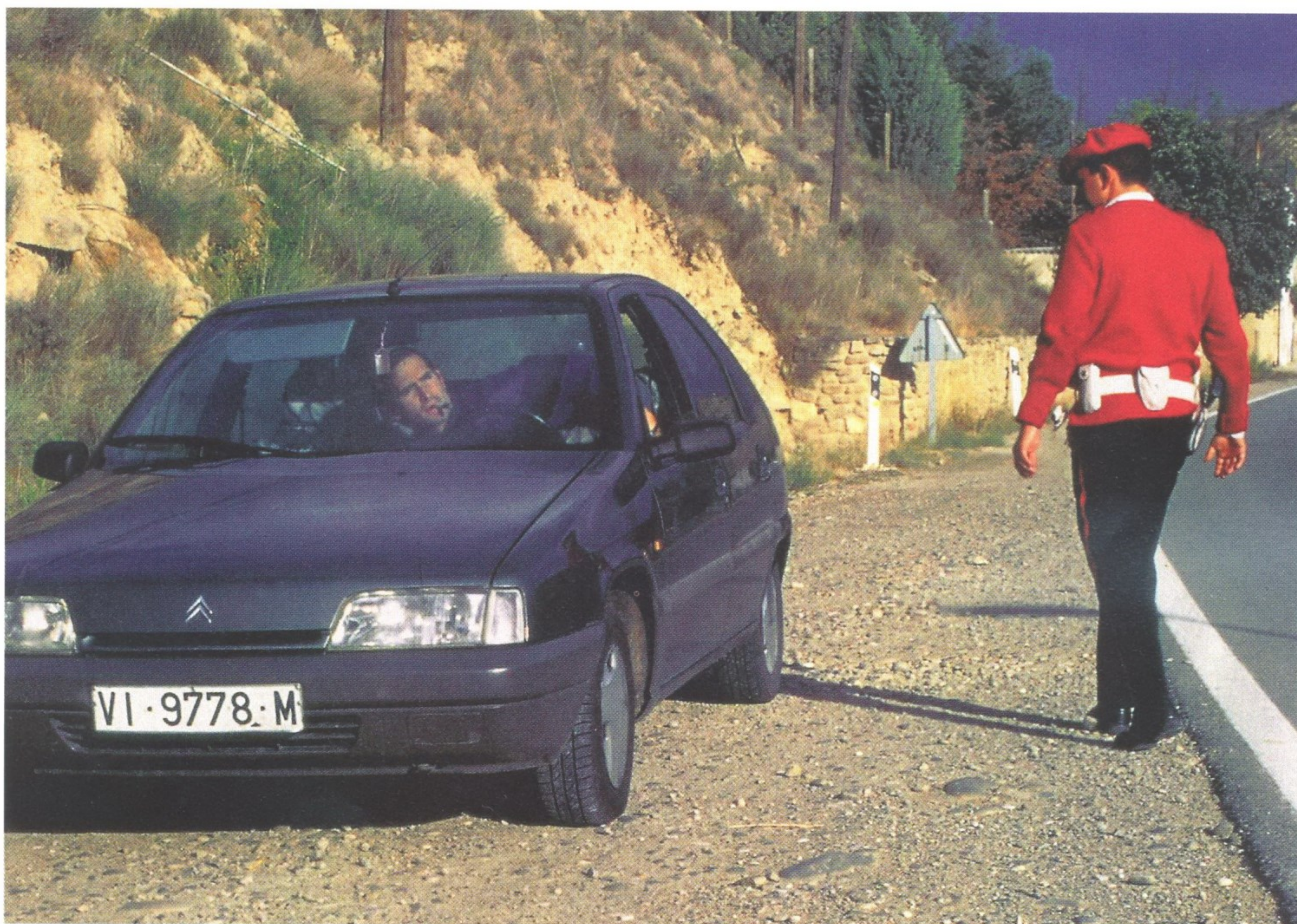
НА СЛУЖАЩИХ ERTZAINZA, ПОМИМО ПРОЧЕГО, ВОЗЛОЖЕНА ОБЯЗАННОСТЬ ПО ПОДДЕРЖАНИЮ ПОРЯДКА НА ДОРОГАХ АВТОНОМИИ

Ertzaintza обеспечивает общественный порядок и соблюдение законов, борется с терроризмом, распространением наркотиков, контролирует дорожное движение. В баскской полиции есть свой научный отдел и департамент аналитики и исследований. В составе полицейских сил Страны Басков действует и специальная группа по освобождению заложников.