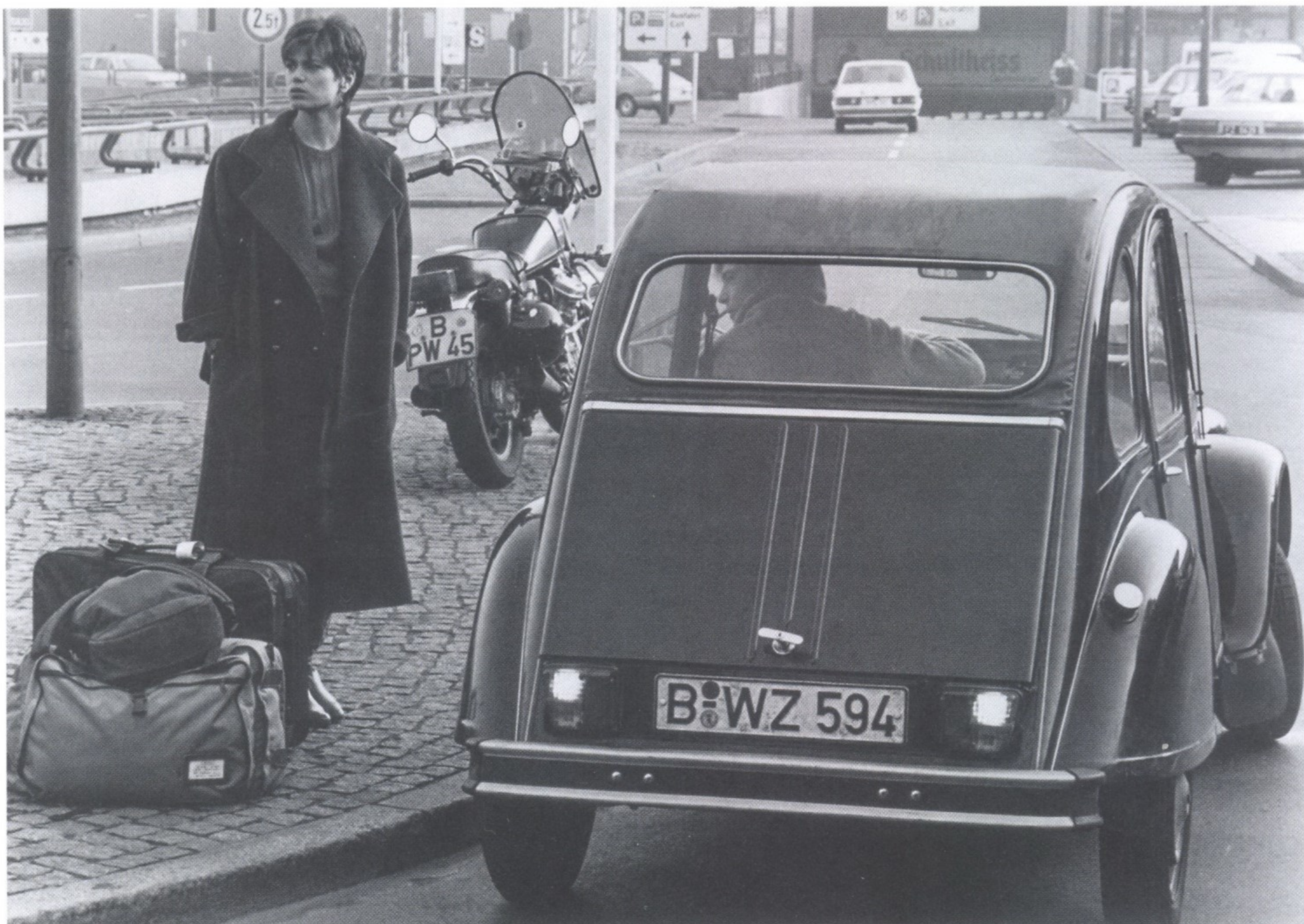
ЛИНДА ФИОРЕНТИНО И CITROEN 2CV В ФИЛЬМЕ ДЖЕФФА КАНЕВА «ПОПАЛСЯ! ПОПАЛСЯ!» (1985 ГОД)

Официальная презентация Citroen 2CV состоялась на традиционном Парижском автосалоне 1948 года. Реакция специалистов и публики была неоднозначной. Крохотный двухцилиндровый горизонтальный двигатель объемом 345 см 3 и мощностью 9 л. с., независимая подвеска всех колес на двух рычагах с пружинами, брезентовая крыша, невысокая максимальная скорость (60 км/ч) — у одних это вызывало усмешку, другие акцентировали внимание на том, что 2CV, несмотря на свой неказистый внешний вид, вмещал четырех человек — целую семью! В итоге судьбу модели решили покупатели, проголосовавшие кошельками за симпатичного «малыша». И это вполне объяснимо: времена тяжелые, денег у французов немного, поэтому экономичный автомобильчик оказался как нельзя кстати. Более того, спрос на него был ажиотажным, завод не справлялся с заказами, и в результате очередь на машину растянулась на несколько лет. И это при том, что объемы производства за год выросли в 100 раз: от четырех машин в день в 1949 году до 400 в 1950-м.