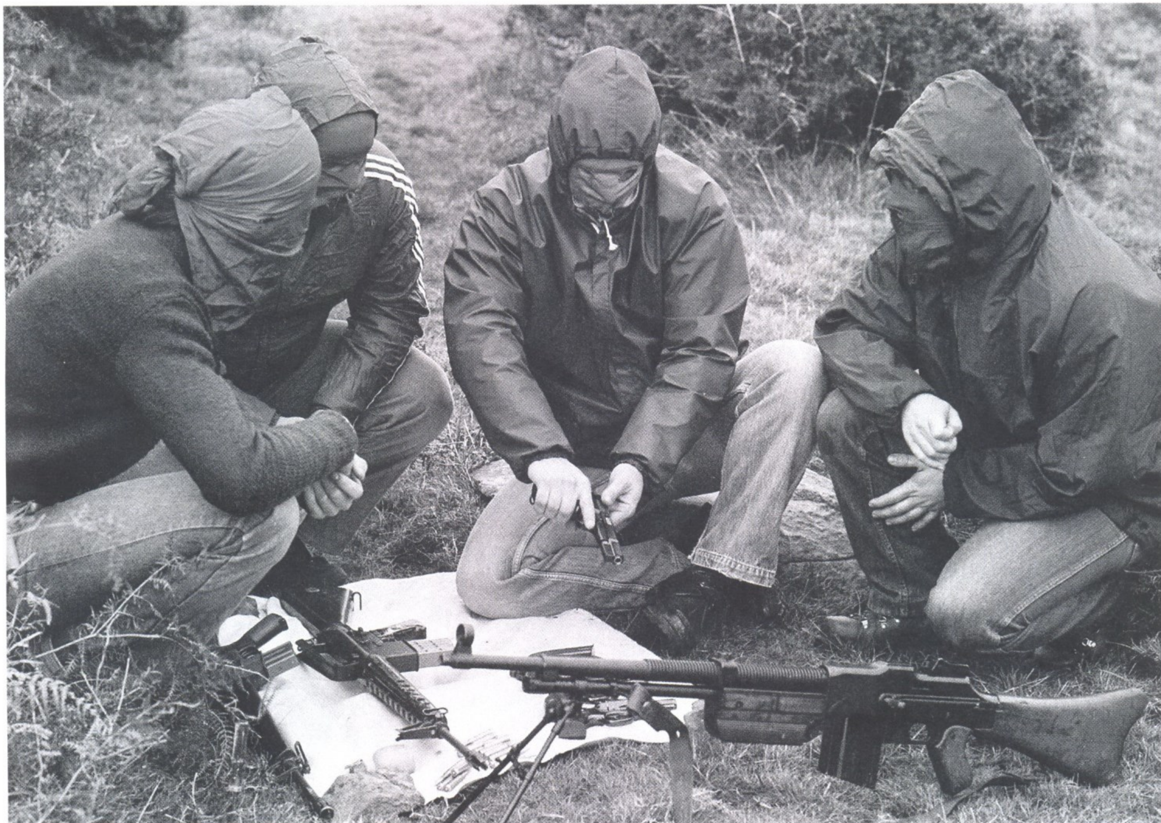
БОЕВИКИ ЭТА ПРОВОДЯТ ОЧЕРЕДНУЮ ТРЕНИРОВКУ ПО СРЕЛЬБЕ

Политические методы борьбы баскские националисты посчитали неэффективными и встали на путь террора. Для начала они совершили серию покушений на испанских чиновников, военных, судей и полицейских, наиболее активно действовавших против сепаратистов.