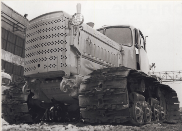
Трактор ДТ-75К можно было оборудовать такими же широкими гусеницами, как на болотоходной версии – ДТ-75Б.