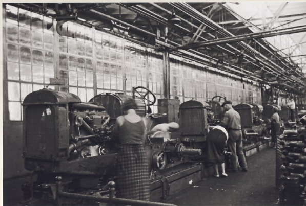
Сборочный цех Сталинградского тракторного завода им. Ф. Э. Дзержинского. 1937 г.

В русской литературе XIX–XX веков отношение к технике было почти исключительно отрицательным. Техника представляла неким чудовищем, безжалостным к человеку. И. Некрасов в «Плаче детей» пишет: Бесполезно плакать и молиться, Колесо не слышит, не щадит: Хоть умри – проклятое вертится, Хоть умри – гудит – гудит – гудит! С. Есенин в «Сорокоусте» называет технику «скверным гостем» с «железным брюхом». А. Блок описывает фабрику как некую мистическую темную силу: «...Недвижный кто-то, черный кто-то людей считает в тишине». В романе М. Горького «Мать» фабрика выкидывает «людей из своих каменных недр, словно отработанный шлак». К 1930-м годам отношение к технике меняется на противоположное. Она буквально становится героем времени. Философ Н. Бердяев с ужасом писал: «...единственной сильной