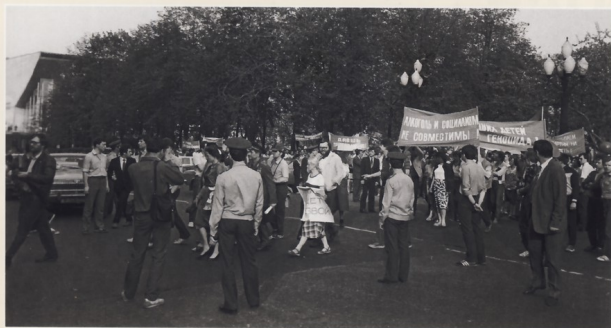
Антиалкогольная демонстрация на Пушкинской площади. 1987 г.

В 1920–1932 годах сухой закон действовал в США. Он привел к росту преступных организаций, занимавшихся контрабандой и нелегальным производством и распространением спиртных напитков – бутлегерством. Принимали подобные меры (с разными результатами) и многие другие страны. По данным на 2009 год, сухой закон в различной степени строгости существует в нескольких десятках стран мира. А в Полинезии в этом же году запрет на алкоголь был отменен. Он действовал здесь 200 лет!