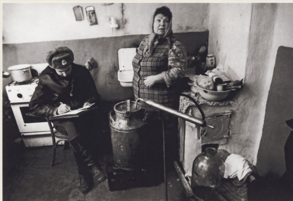
Рейд по борьбе с самогонным делом. Краснодарский край. 1987 г.

Следующая кампания по борьбе с пьянством относится к правлению Н. С. Хрущева. Она началась в 1958 году с принятия постановления «Об усилении борьбы с пьянством». Был введен запрет на продажу водки в сфере общественного питания вокзалов и аэропортов, вблизи промышленных предприятий, учебных заведений, парков отдыха, стадионов и других мест массового скопления людей. Цены на алкоголь не поднимали и продажи не ограничивали. Самая активная борьба развернулась с самогонным делом. Фильм Л. Гайдая «Самогонщики», где сложилась легендарная тройка Вицин, Никулин и Моргунов, сегодня выглядит милой шуткой. Действительность была более жестокой: в 1958 году за