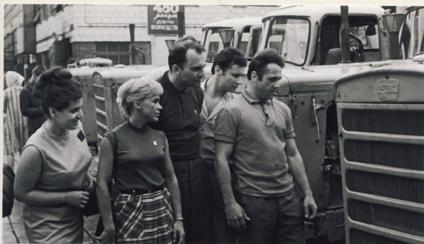
Новые тракторы – настоящая достопримечательность города. Экскурсия на заводе. 1968 г.

СМД-14 – четырехтактный четырехцилиндровый бескомпрессорный дизель с вихрекамерным смесеобразованием и водяным охлаждением. Его номинальная мощность – 75 л. с. при 1700 об/мин коленчатого вала. Основное