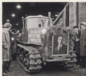
Первый трактор семейства ДТ-75, сошедший с конвейера реконструированного завода. 1964 г.

Герметичность соединений, воздухоочистительная установка, мягкие подressоренные сиденья, удобное расположение рычагов управления обеспечивают комфортабельные и хорошие санитарно-гигиенические условия труда.