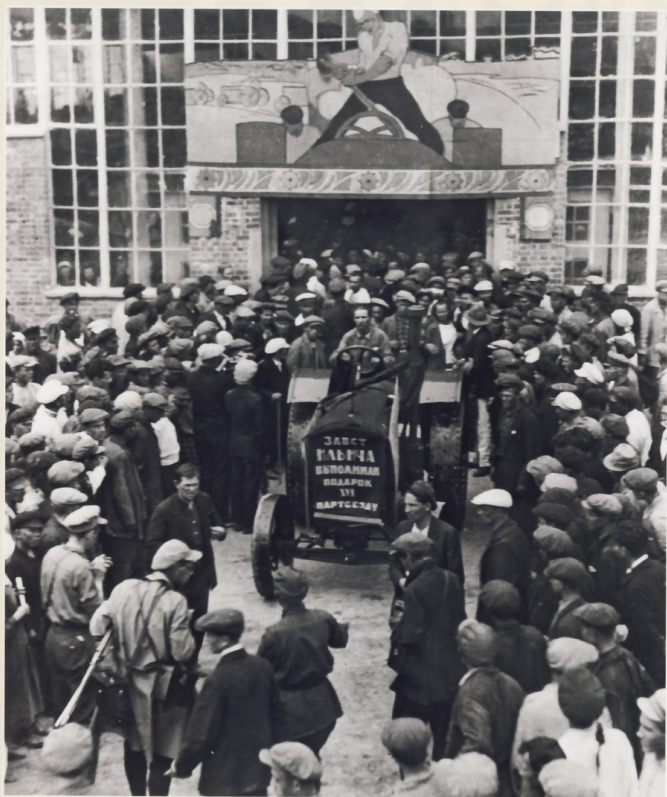
Первый трактор СТЗ-15/30 сошел с конвейера СТЗ 17 июня 1930 года.

верой современного цивилизованного человека остается вера в технику... Техника есть последняя любовь человека, и он готов изменить свой образ под влиянием предмета своей любви». Поэтесса М. Шагинян объясняла: «...мы, писатели, увлеклись в ту пору вещами и техникой, машиной, проектами, даже названиями инструментов. Весь этот мир был для нас нов».