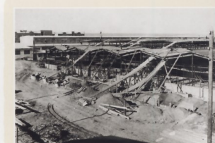
Строительство сборочного цеха Сталинградского тракторного завода. 1928 г.