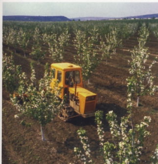
На склонах важно, чтобы трактор был приспособлен работать челночным способом.

Для работы на склонах со слабыми грунтами трактор можно было «переобуть» в широкие гусеницы, которые применялись на болотоходной модификации – ДТ-75Б, а для этого оборудовать специальными ведущими колесами. Их поставляли вместе с трактором.