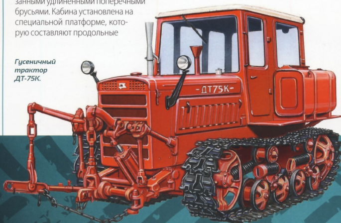
Гусеничный трактор ДТ-75К.

и поперечные профильные балки, собранные совместно с крыльями обшивки в прочную жесткую раму. Платформа закреплена к верхним кронштейнам и задним фланцам рамы с помощью шести резиновых амортизаторов. Два, в передней части, размещены на кронштейнах рамы и четыре – на кронштейнах задних фланцев рамы, парами. Амортизаторы смягчают толчки от остова трактора при движении по неровному грунту. Корпус кабины прямоугольный, состоит из штампованных крыши и стенок, соединенных друг с другом при помощи контактной сварки. Конструкция кабины позволяет разместить органы дублированного управления, переднее и заднее сиденья тракториста и обеспечить оптимальную обзорность при переднем и заднем ходе трактора. Кабина ДТ-75К относительно оси трактора смещена вправо. Благодаря этому капот двигателя не мешает следить за рабочими органами орудий, сохраняя при этом прямую позу.