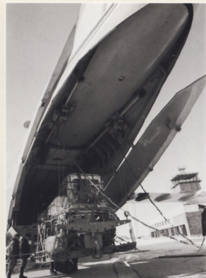
В 1984 году для создания дрейфующей арктической станции на льдину с самолета ИЛ-76 был спущен на парашюте трактор ДТ-75.

На ДТ-75К через окна возможна естественная вентиляция кабины. Но такие благоприятные условия бывают редко, и чаще приходилось окна закрывать и включать вентиляционно-очистительную установку. От вала электродвигателя приводится во вращение вентилятор, забирающий воздух внутри основания над поверхностью воды в поддоне и перегоняет его внутрь кабины через распределительный патрубок. Из-за образовавшегося разрежения под воздействием атмосферного давления в полость основания начинает поступать наружный воздух. Одновременно водяная помпа по резиновому шлангу подает воду из поддона в вентиляционную трубку к разбрызгивателю. В трубе воздух, поступающий снаружи, перемешивается с мелко распыленной водой. Пыль и прочие посторонние частицы оседают на капельках воды. Попадая на испарительные пластины, вода быстро испаряется, благодаря чему снижается температура пластин и проходящего мимо них воздуха.