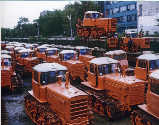
Трактора ДТ-75 на Волгоградском тракторном заводе. 1972 г.

Подъехав к месту работы, тракторист опускает в рабочее положение одно орудие, оставив противоположное в поднятом положении. В конце первого прохода поднимает орудие, пересаживается на противоположное сиденье и переключает реверс-редуктор на движение в обратную сторону. Заглубив противоположное орудие, он движется в обратную сторону.