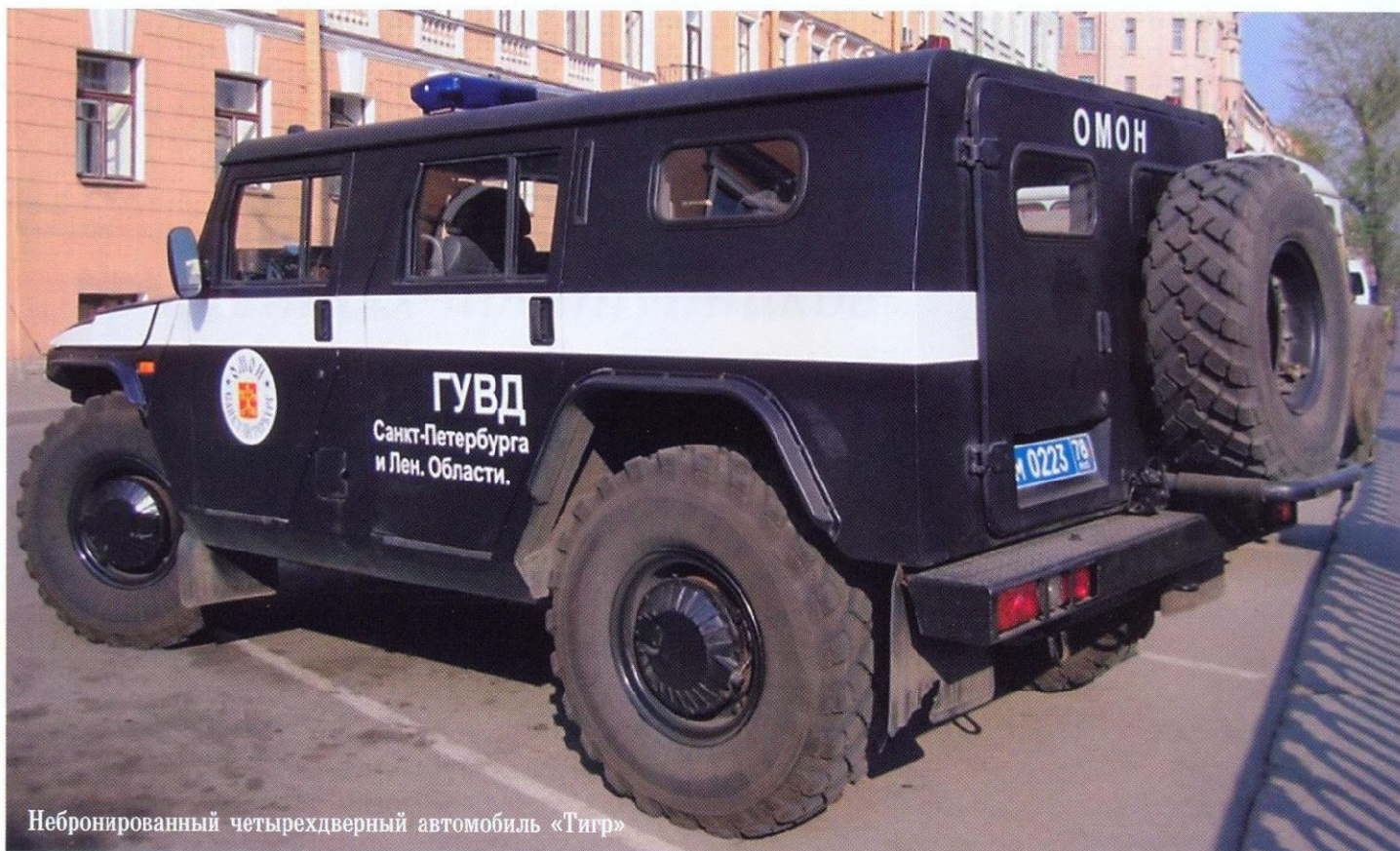
Небронированный четырехдверный автомобиль «Тигр»

потенциальным заказчиком, заинтересовавшимся автомобилем, который к тому моменту получил название ГАЗ-233034 «Тигр», стало МВД России. Две машины приняли в опытную эксплуатацию в московский СОБР. Серийный выпуск автомобиля «Тигр» был организован на Арзамасском машиностроительном заводе. Основной конструкции «Тигра» является рама, на которую монтируется базовая часть агрегатов машины. В передней части рамы установлен американский шестицилиндровый дизель Cummins B205 с турбонаддувом мощностью 205 л. с., что