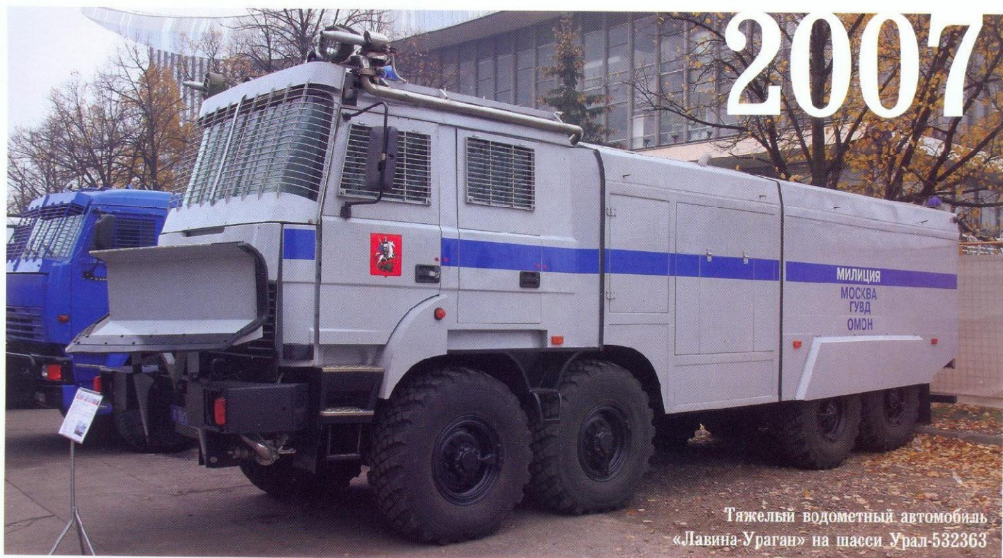
Тяжелый водометный автомобиль «Лавина-Ураган» на шасси Урал-532363

Конец 80-х — начало 90-х было непростым временем для ОМОНа. Сотрудникам этих подразделений пришлось решать не только задачи по охране общественного порядка. Вооруженное участие рижского и вильнюсского ОМОНа в борьбе против независимости Латвии и Литвы в 1991 году стало одной из самых мрачных страниц в истории советской милиции.