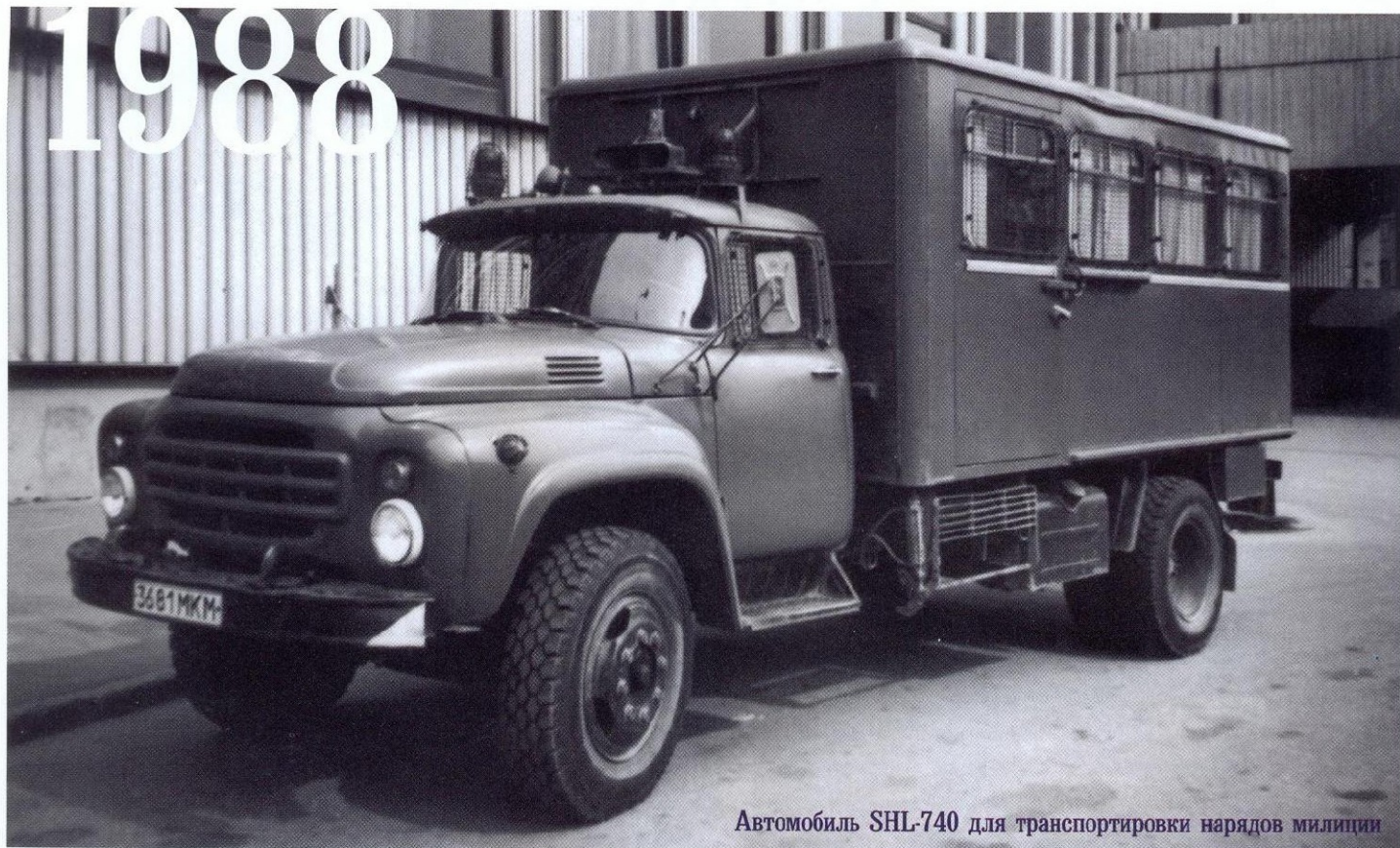
Автомобиль SHL-740 для транспортировки нарядов милиции

на вооружение милиции резиновых палок, наручников и взрывчатых пакетов со слезоточивым газом. Однако до формирования милицеских спецподразделений тогда дело не дошло.