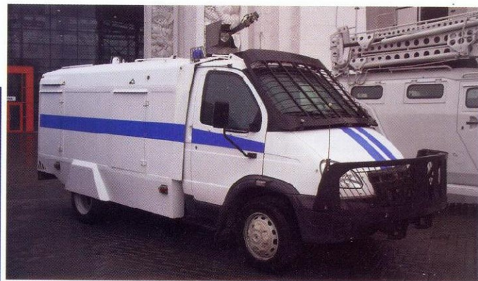
Водометный автомобиль «Гроза» малого класса на шасси ГАЗ-33104 «Валдай»