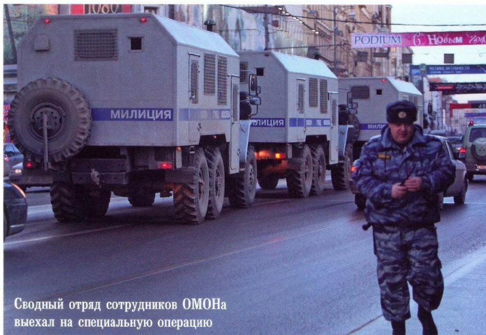
Сводный отряд сотрудников ОМОНа выехал на специальную операцию

■ Первого марта 2002 года министр внутренних дел Российской Федерации Б. Грызлов подписал приказ за № 190, согласно которому 3 октября становится официальным Днем отрядов милиции особого назначения (ОМОНа). Дата 3 октября выбрана в связи с тем, что именно Приказом МВД СССР № 0206, изданным в этот день в 1988 году, в России, Белоруссии, Украине и Казахстане были созданы первые отряды милиции особого назначения органов внутренних дел.