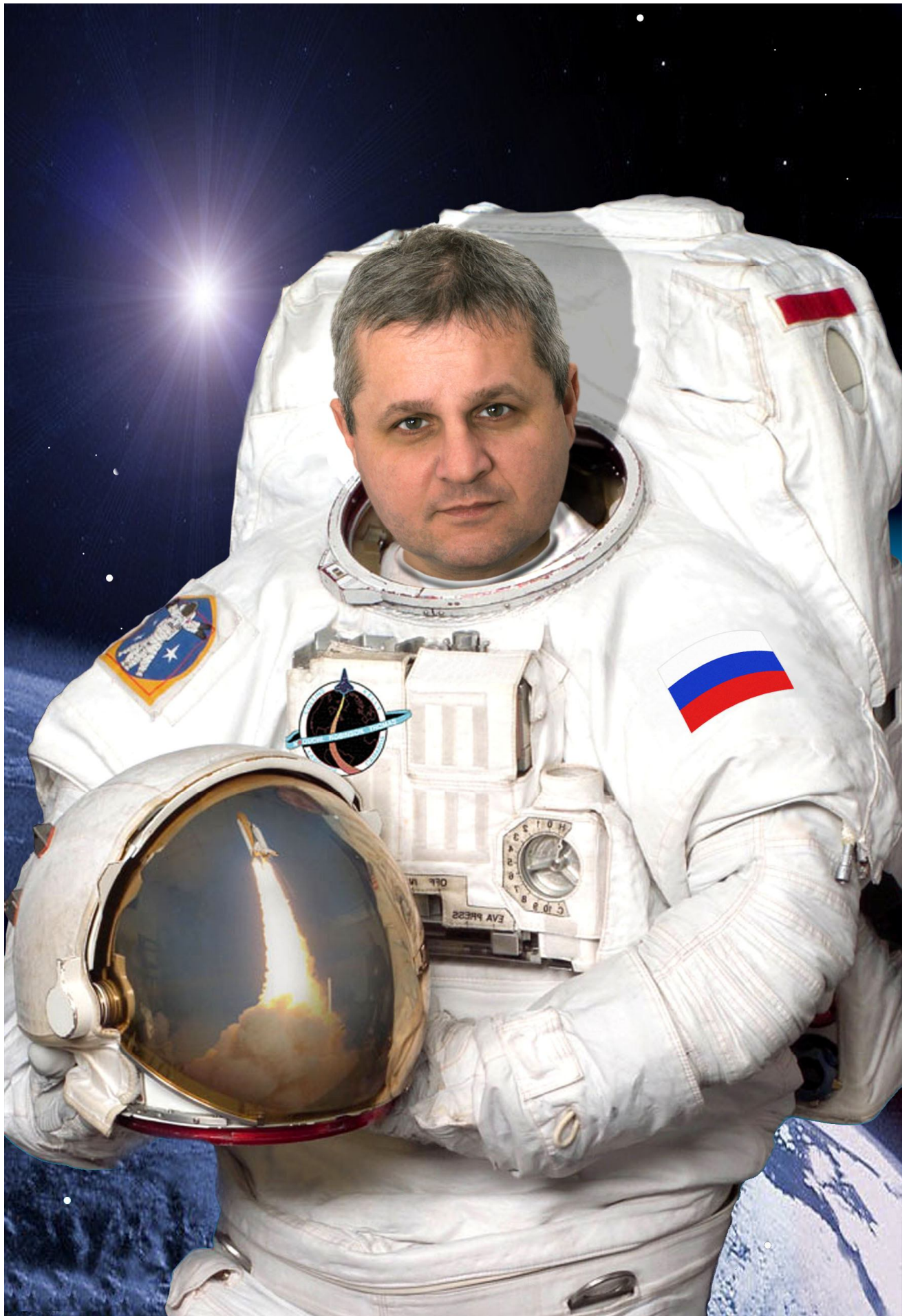
L una * O leg * V ladimirovich * E rmakov