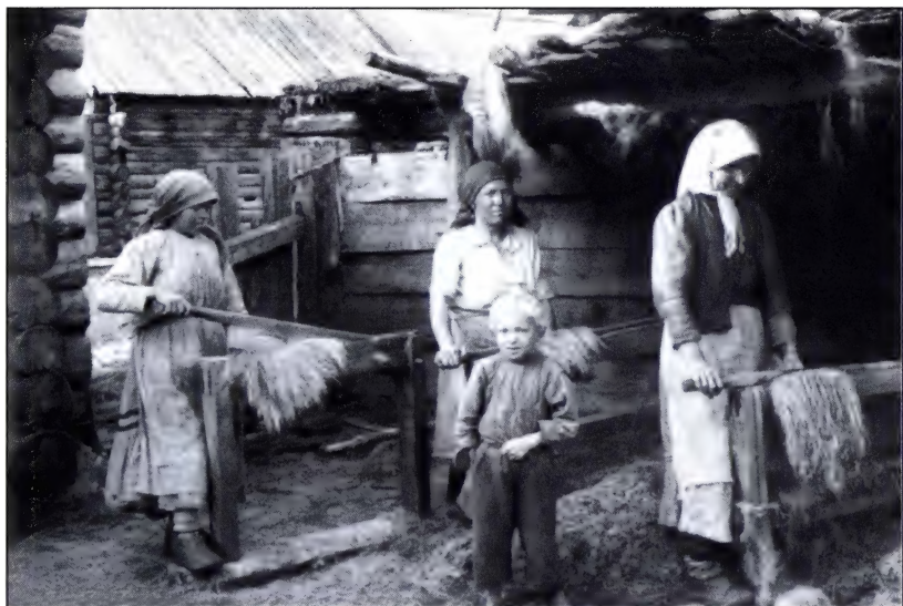
Мялка льна. Село Городище Тавдинского района.