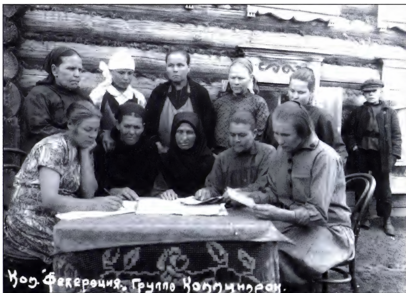
Группа коммунарок коммуны «Федерация». 20-е годы.