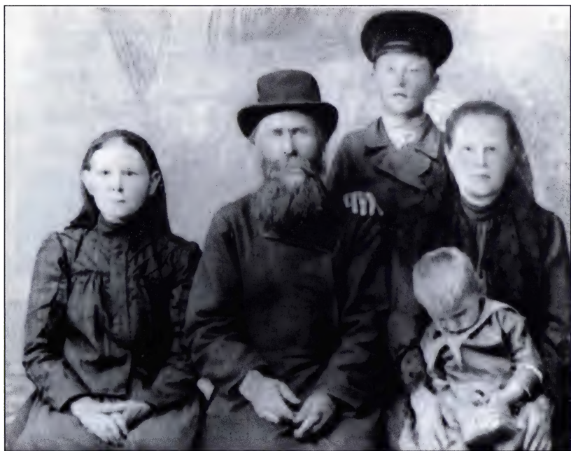
Крестьянская семья. 1916 г.