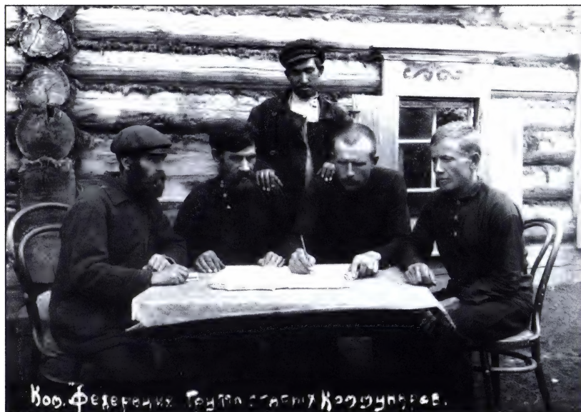
Группа коммунаров коммуны «Федерация» Еланского района. 20-е годы.