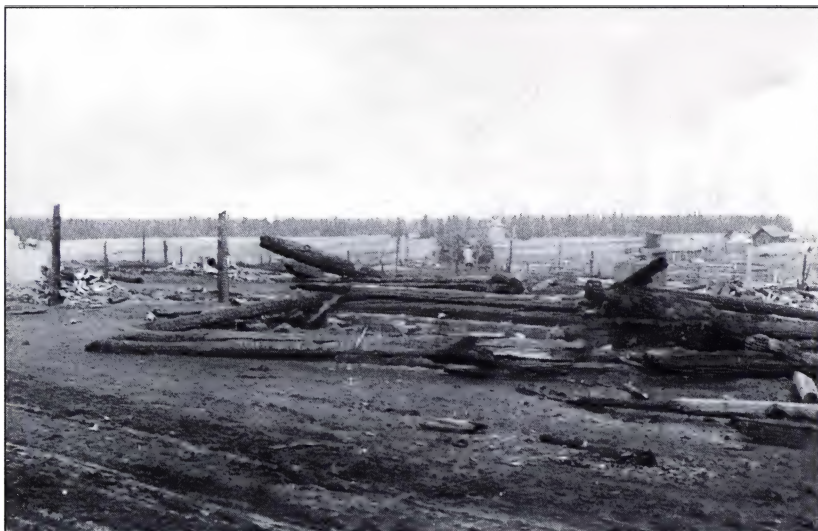
Деревня Ларина Еланского района после пожара. Лето 1929 г.