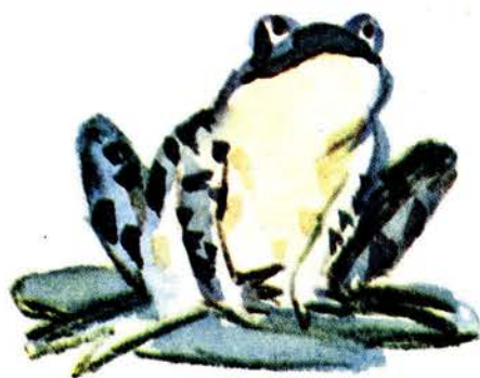
Рисунки Ю. Тризны