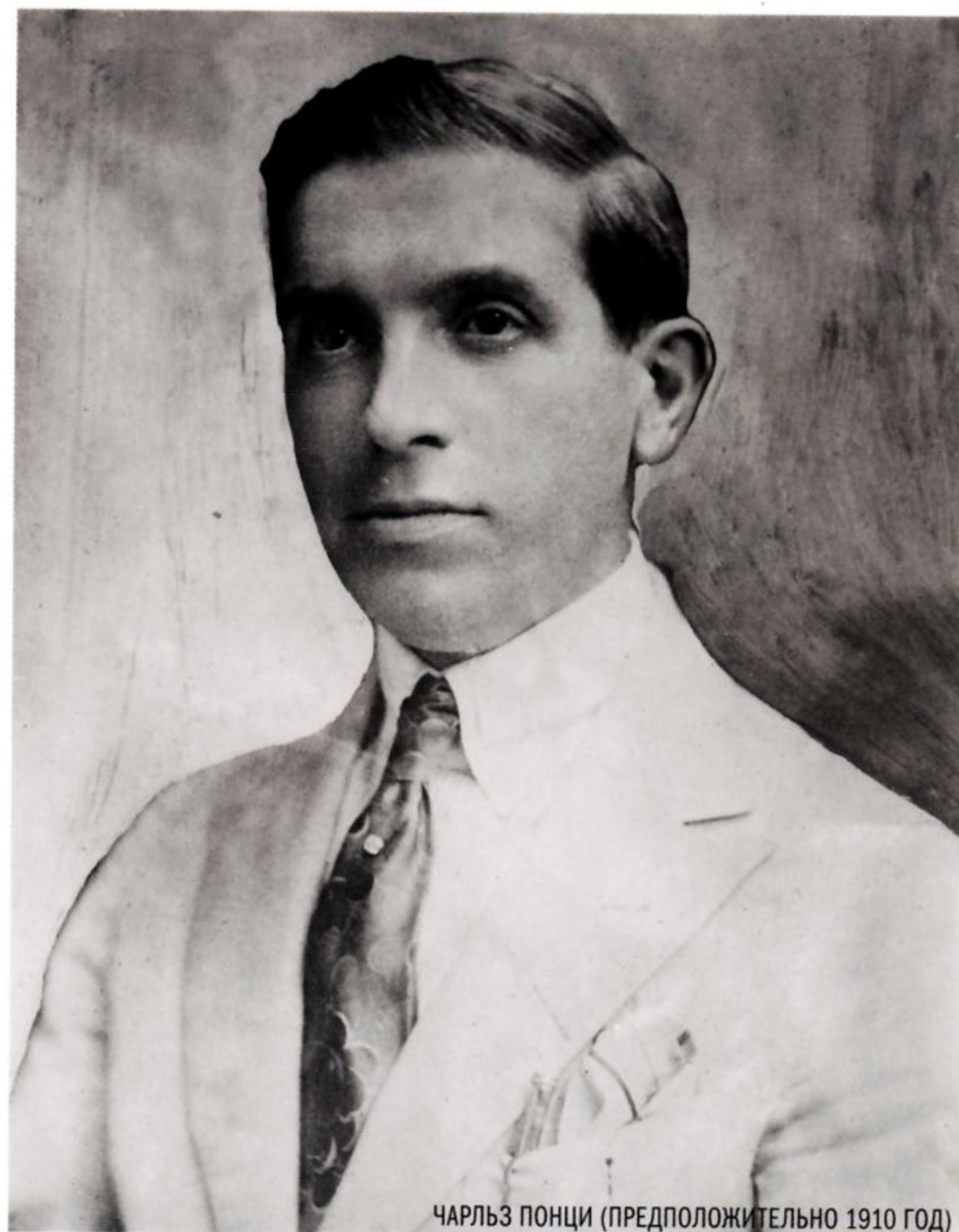
ЧАРЛЬЗ ПОНЦИ (ПРЕДПОЛОЖИТЕЛЬНО 1910 ГОД)

В Америке Карло превратился в Чарльза и начал «делать карьеру». Поначалу молодой человек работал мойщиком посуды в заштатном ресторанчике, но довольно быстро выучил язык и получил должность официанта. При этом он так беззастенчиво обшчитывал клиентов, что хозяевам заведения вскоре пришлось его уволить. Тогда предприимчивый итальянец решил попытать счастья в Канаде, где занялся более доходным ремеслом — финансовыми махинациями, за что был арестован и приговорен к трем годам лишения свободы. Правда, уже через 20 месяцев Понци покинул монреальскую