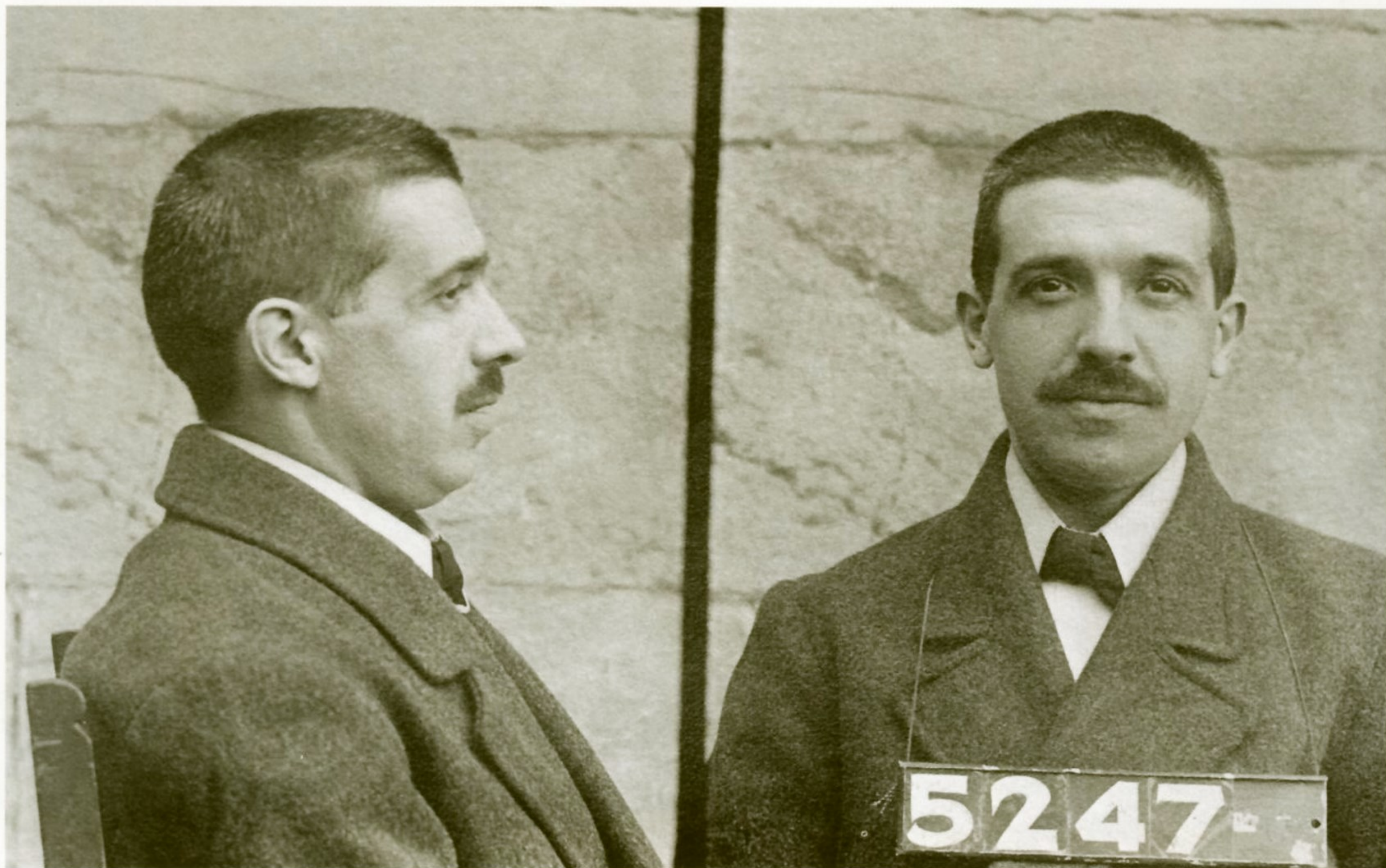
ФОТО ИЗ ПОЛИЦЕЙСКОГО ДОСЬЕ ЧАРЛЬЗА ПОНЦИ (13 АВГУСТА 1920 ГОДА)

отдавал фирме Понци в среднем 300 долларов, но были и те, кто вносил по 50 тысяч и более. Жажда наживы охватила не только население Бостона, но и жителей всего штата Массачусетс.