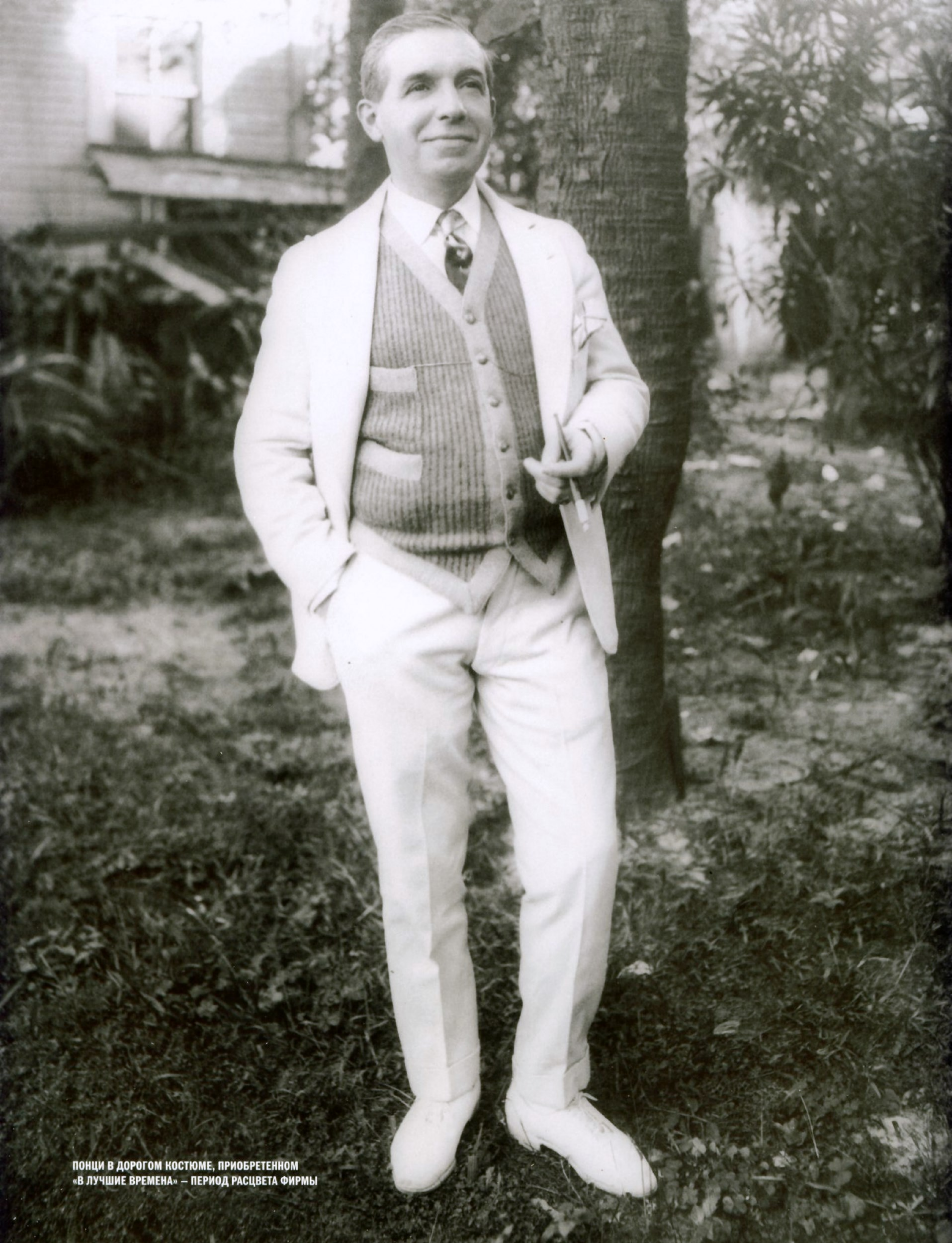
ПОНЦИ В ДОРОГОМ КОСТЮМЕ, ПРИОБРЕТЕННОМ «В ЛУЧШИЕ ВРЕМЕНА» — ПЕРИОД РАСЦВЕТА ФИРМЫ